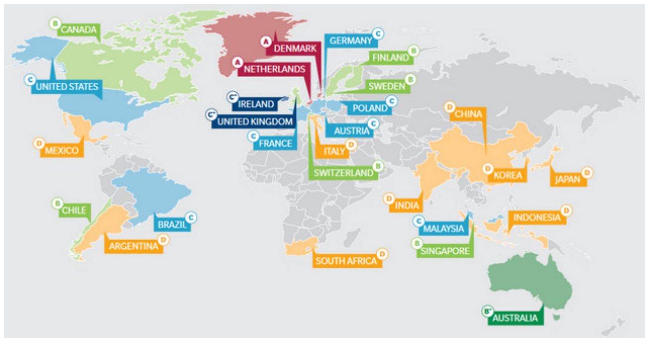
"Пенсионная" карта мира