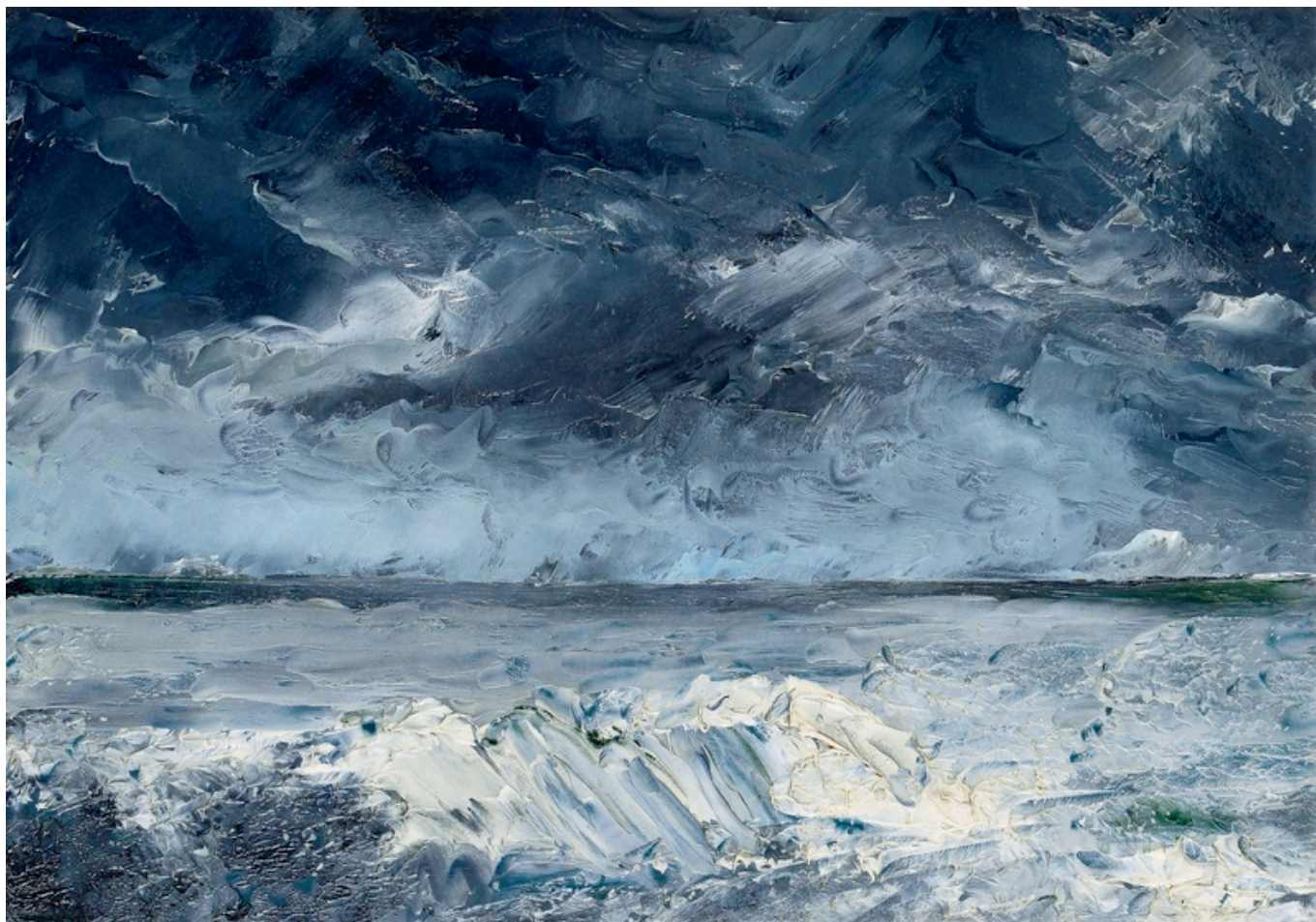
Август Стринберг. Лед на побережье, 1892. Частная коллекция

Author: Надежда Сикорская, Лозанна , 14.10.2016.