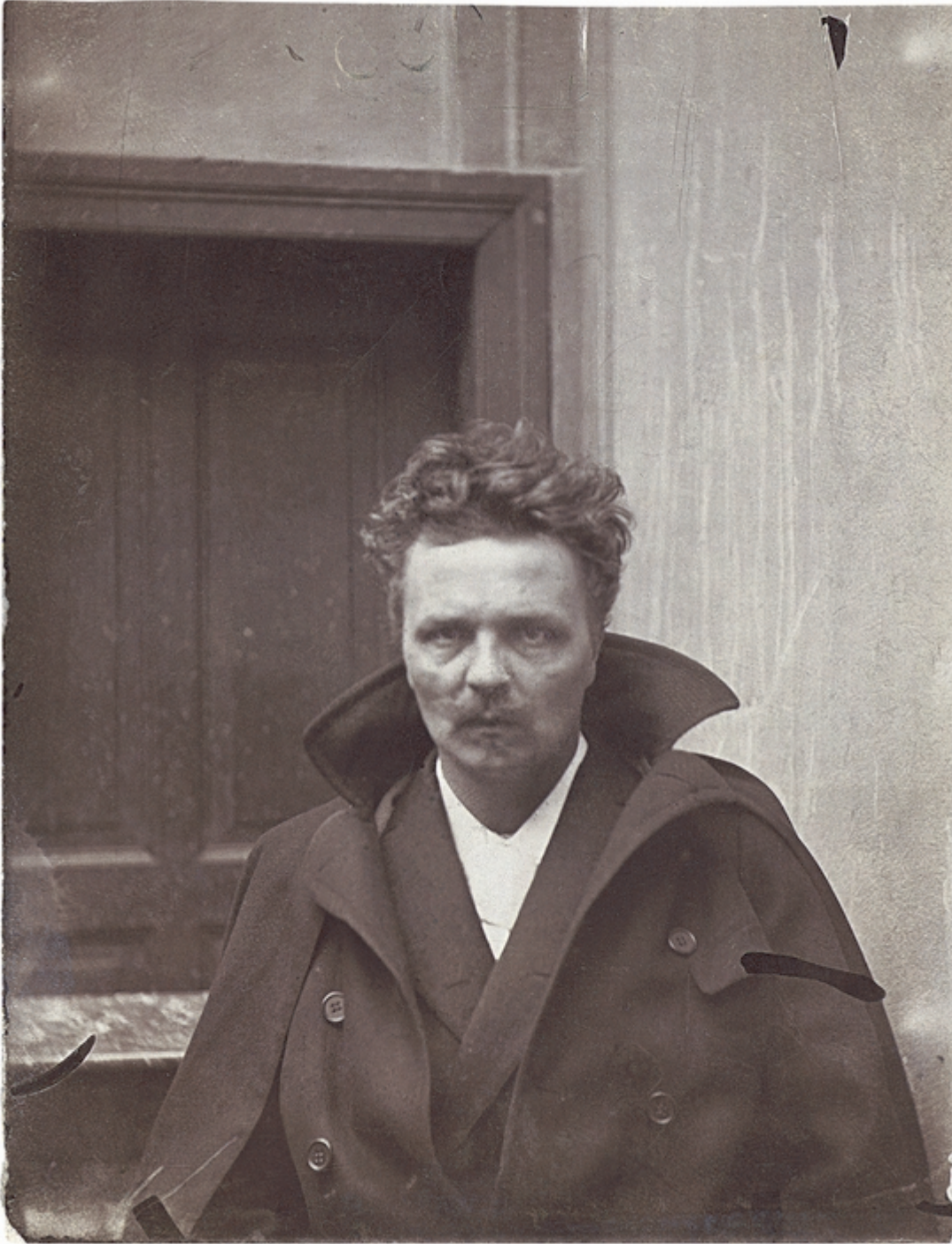
Август Стринберг. Автопортрет, Герсау, 1893-1894. Stockholm, Kungliga Biblioteket

При этом далеко не все знают о втором увлечении Стринберга, ставшим практически его второй профессией. С 1870-х годов и до начала XX века, то есть пока позволяло здоровье, Стринберг много путешествовал, проводя значительные периоды времени во Франции, Австрии, Германии и Швейцарии. Именно во время этих поездок он начал экспериментировать как художник и фотограф. Самоучка, Стринберг со временем стал одним из самых значительных художников Швеции, создав редкие по современности произведения, среди которых несколько потрясающих пейзажей, отражающих неистовство природных стихий. По мнению специалистов, среди