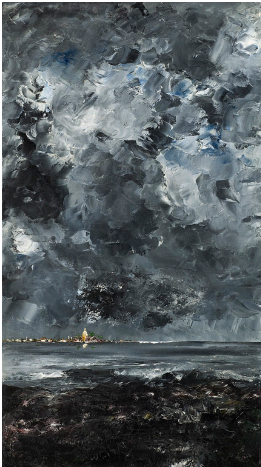
Август Стринберг. Город, 1903 (© Hans Torwid / Nationalmuseum Stockholm)

Период 1886-1906 годов, большая часть которого прошла в швейцарском городе Герзау, на берегу озера Четырех кантонов, стал временем поиска правды в искусстве. «Я ищу правды в искусстве фотографии, ищу напряженно, как и во многих других областях», - пишет Стринберг. Именно тогда появилась целая серия его автопортретов, на которых он предстает в образах писателя, отца семейства, садовника и даже русского нигилиста, и фотопортретов окружавших его людей.