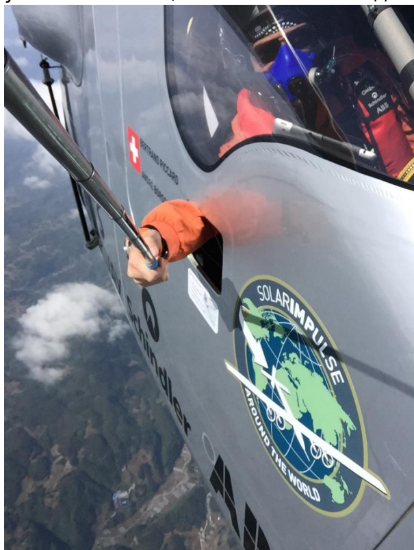
Селфи над Китаем

Непосредственное участие в проекте принимали около 150 человек , включая исследователей и ответственных за связи с общественностью. В 2003 году коллектив насчитывал четырех основателей, в 2012-м над общей задачей увлеченно трудились уже 70 человек, а к июлю этого года цифра удвоилась.