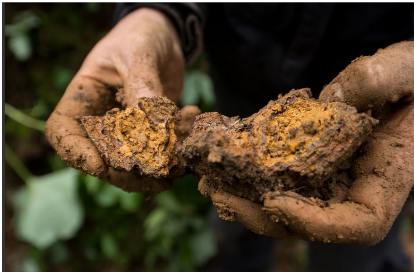
Радость первых находок красного железняка

Если дальше все пойдет хорошо – то есть, если разные учреждения кантона Во вложат в проект нужную сумму (сотни тысяч франков), – то исторический клинок засверкает в лучах солнца весной 2018 года.