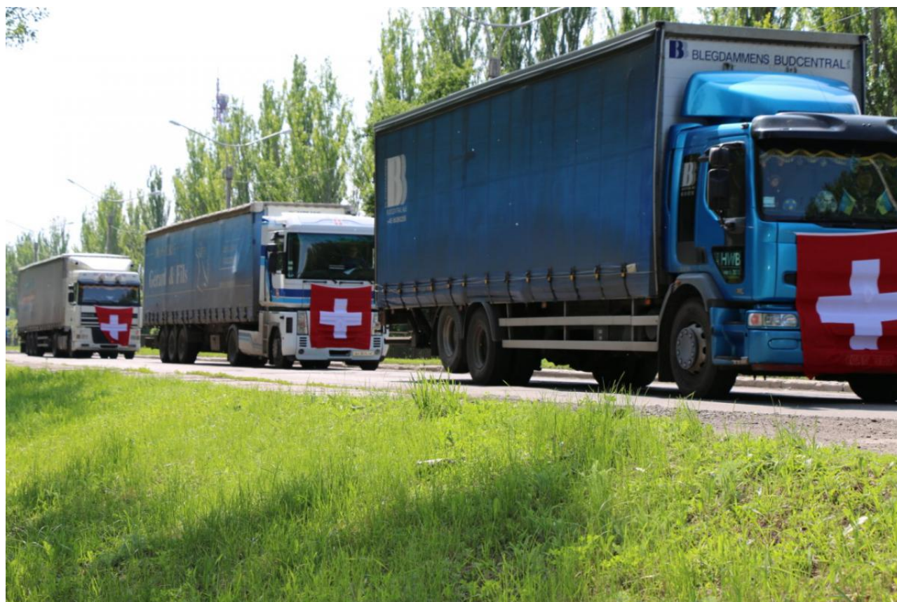
Украина, 2015 год

Следует отметить, что среди получателей швейцарской ОПР фигурируют не только страны и целые регионы Африки (Великие Африканские озера, Мозамбик, Танзания, Нигер, Мали, Африканский Рог и другие), Азии (бассейн реки Меконг, Непал, Бангладеш и другие), Латинской Америки (Боливия, Куба, Гаити и т.д.), но и представители постсоветского пространства.