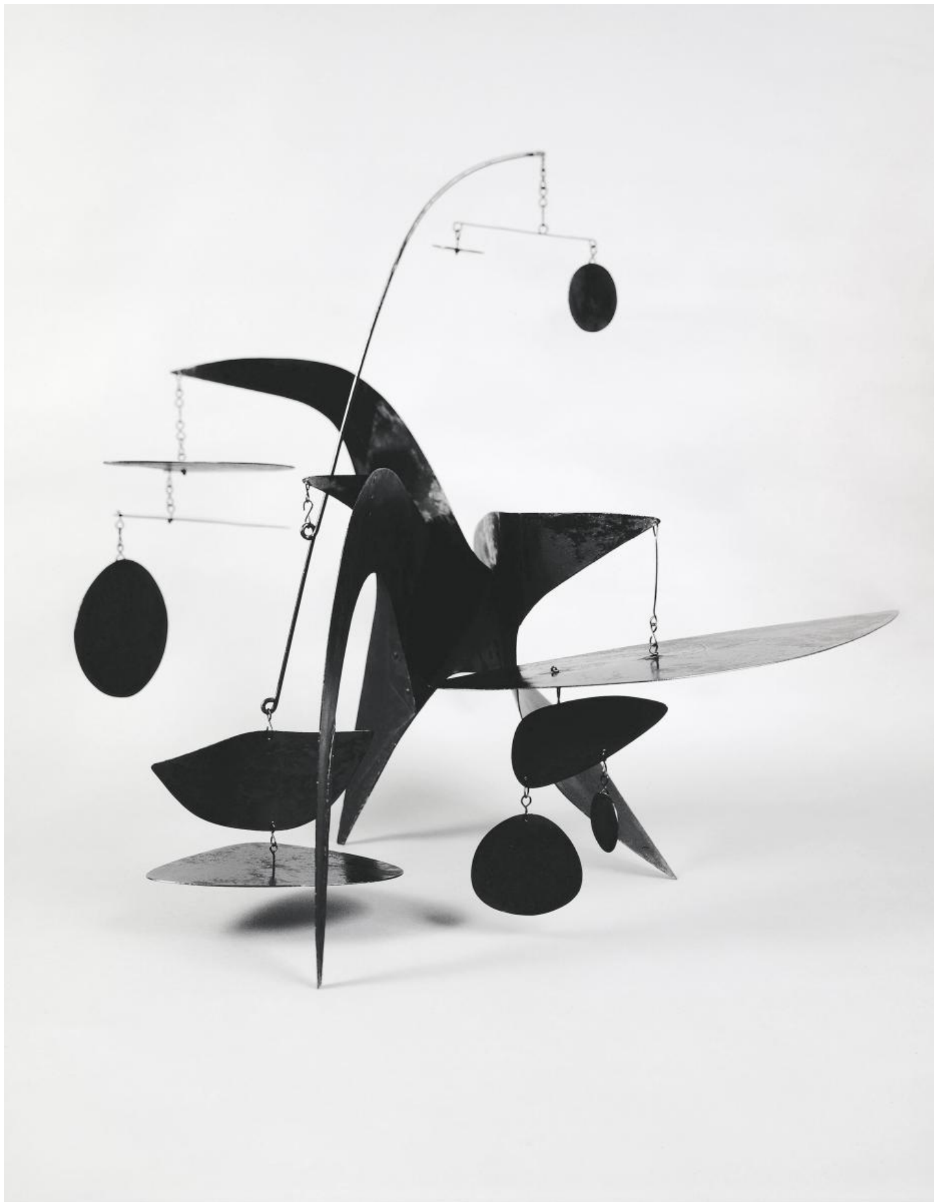
Александр Колдер. The General Sherman, 1945 (© 2016 Calder Foundation, New York/ProLitteris, Zurich))

... В самом начале выставки посетитель натывается на крысу и медведя, две фигуры в костюмах, панду и еще одну крысу, размером с ребенка. Они кажутся