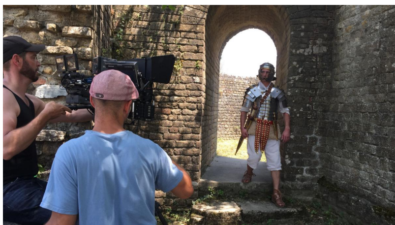
Момент съемок