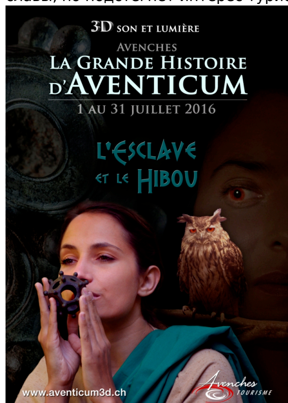
Афиша фильма