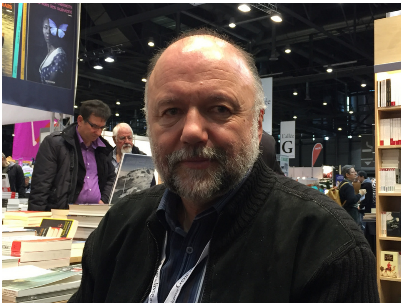
Андрей Курков на Книжном салоне Женевы