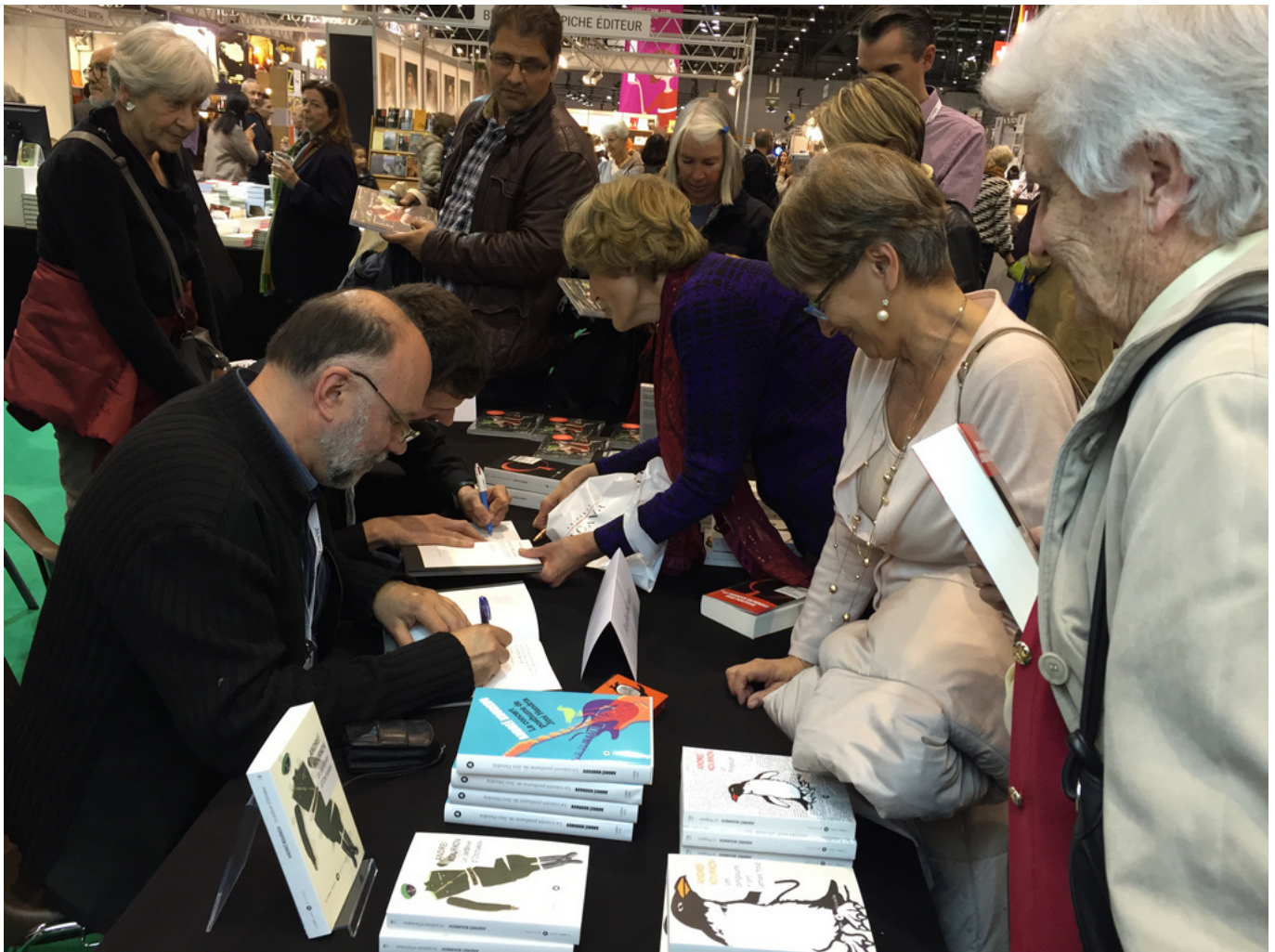
Автографы читателям

В 1990-х годах мои книги выходили в издательстве «Фолио» в Харькове и в «АСТ» Москве, до 2004 года. В 2006 году их переиздало петербургское издательство «Амфора». С тех мои книги в России не выходят и не продаются.