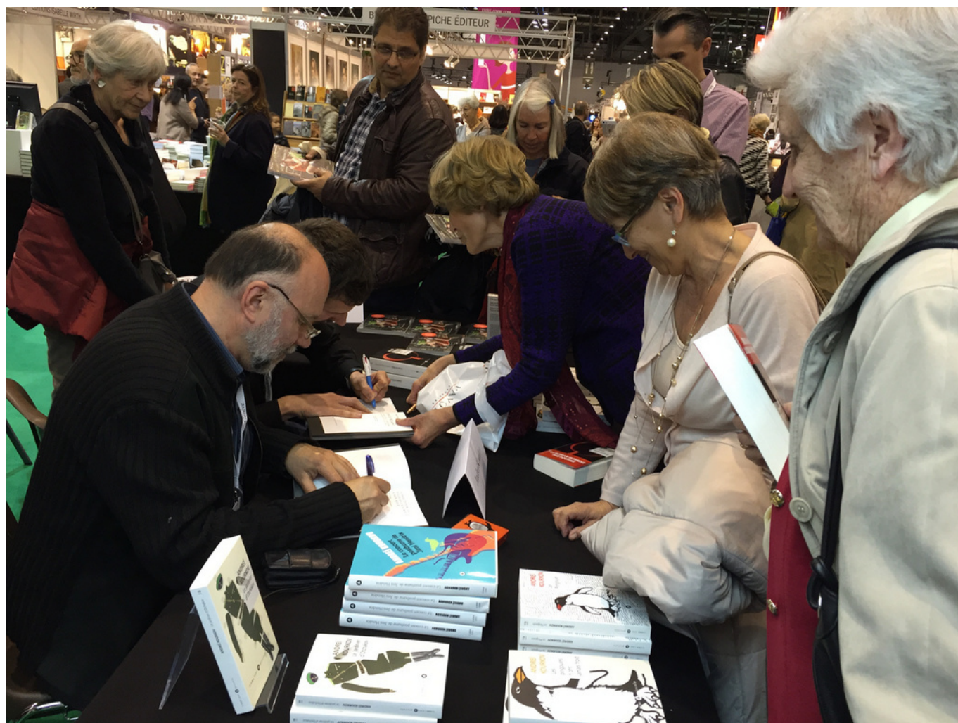
Автографы читателям

В 1990-х годах мои книги выходили в издательстве «Фолио» в Харькове и в «АСТ» Москве, до 2004 года. В 2006 году их переиздало петербургское издательство «Амфора». С тех мои книги в России не выходят и не продаются.