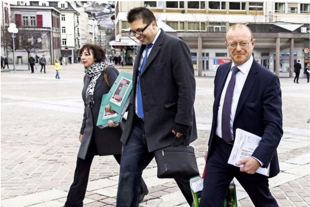
Представители НПШ несут собранные подписи в канцелярию

На этой неделе при поддержке 4385 подписей проект был снова вынесен на суд кантональных властей. Теперь Большому совету и Совету кантонов отводится три года на разработку и внедрение закона, запрещающего покрывать голову в публичных школах. В противном случае инициатива будет вынесена на кантональный референдум, где свое веское слово скажут местные жители.