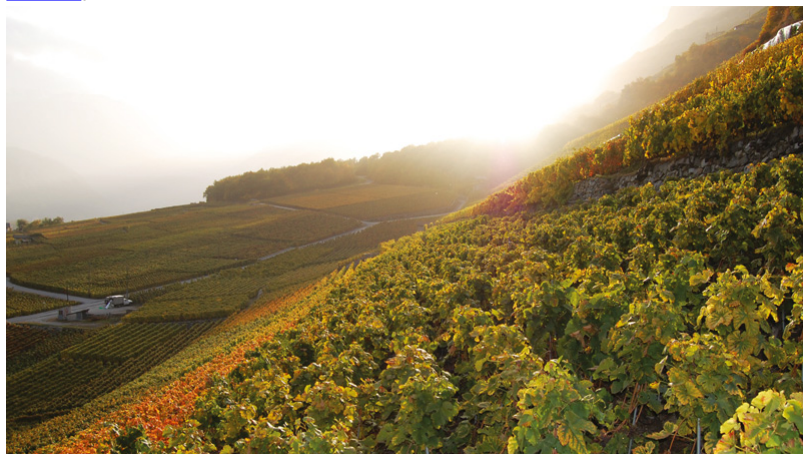
Глядя на такие фото, хочется стать виноделом только ради общения с природой