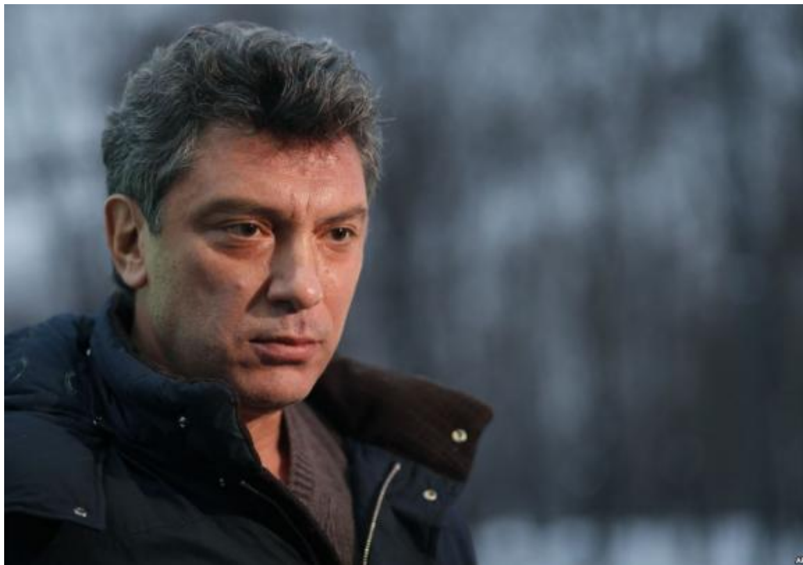
Борис Немцов (1959 - 2015)