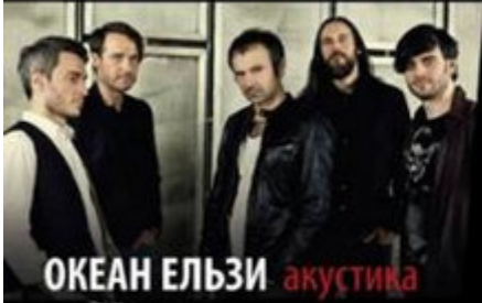
ОКЕАН ЕЛЬЗИ акустика

ШТАДТКАЗИНО БАЗЕЛЬ Ханс-Хубер-Зал Штайненберг 14, 4051 Базель