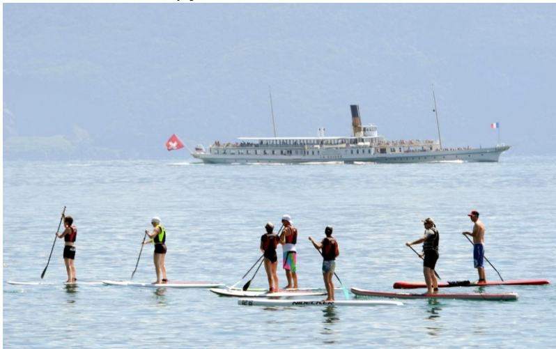
С кораблем наперегонки? (24heures.ch)

В начале XXI века американец Лэрд Гамильтон, проживший всю жизнь на Гавайях, занял у друга длинное лопатообразное весло, с которым, стоя на доске, возродил давнюю традицию и дал начало новому виду спорта. Через несколько лет сапсерфинг распространился за пределы Тихоокеанского региона и покорила другие страны. Написанная Гамильтоном автобиографическая книга вдохновила многих людей разделить его увлечение, а те, кто не любит читать, покупают доски и весла под влиянием друзей.