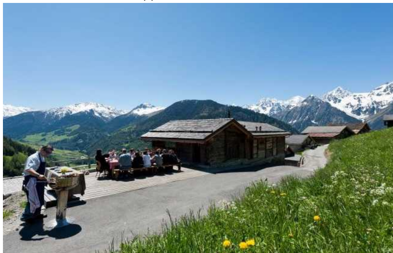
Montagne Alternative – отдых в амбаре (montagne-alternative.com)

туристов было уже 9 отелей. По просьбе клиентов в 1910 году в деревне построили часовню в честь Рождества Христова. Поначалу туристы приезжали в Шампе-Лак главным образом летом, ради купания, экскурсий, катания на лодке, игры в теннис и походов за грибами. Зимой деревня стала массово привлекать путешественников только с 1950-х годов.