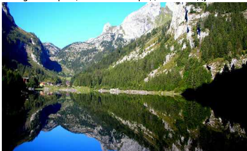
Озеро Тане

Озеро Тане , раскинувшееся на высоте более 1400 метров в коммуне Вуври, очаровывает своим видом, окружающими цветочными полями, сосновыми деревьями с их специфическим запахом и горами. Прогулка вокруг озера и вдоль традиционного валезанского ирригационного канала (bisse) наполняет душу спокойствием, обед в бистро у воды восстанавливает потраченную на прогулку энергию, а сон в гостинице Refuge возвращает силы и придает жажду новых свершений.