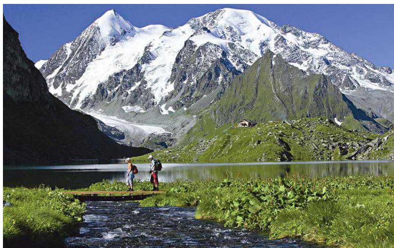
Озеро Луви на высоте 2207 метров: горные дороги, серны и чарующие виды

Добраться до этого тихого места можно так: по канатной дороге из Лойкербада доехать до Даубенского озера, воды которого сверкают в лучах солнца на высоте 2207 метров, а оттуда отправиться пешком. Дорога почти не имеет уклонов, и поэтому до Леммернзее можно дойти менее чем за час. От озера до отеля Lämmernehütte (на высоте 2501 метров) понадобится еще около получаса ходьбы. Самые неустойчивые путешественники дойдут до перевала Гемми, который находится несколько выше Даубенского озера и соединяет долину Кандерталь в кантоне Берн с долиной Далаталь в кантоне Вале. Наградой после долгого подъема станет вид с обзорной площадки: в окружении вершин со снежными шапками легко почувствовать себя победителем. У таких мест есть, пожалуй, лишь один существенный недостаток – оттуда не хочется уходить.