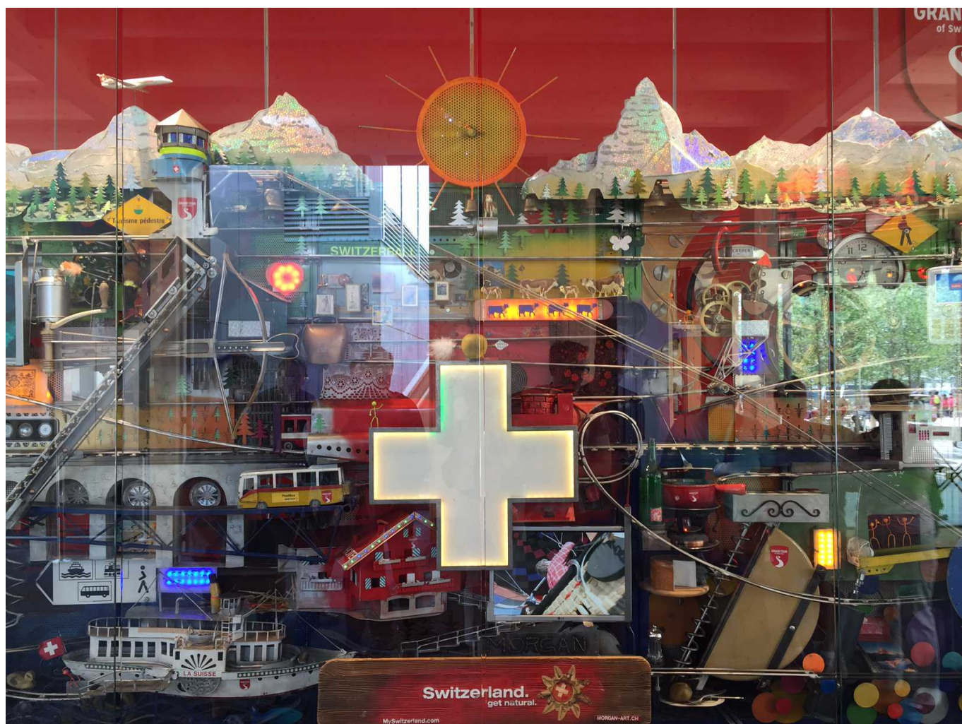
Витрина Швейцарского павильона на Экспо-2015

Author: Надежда Сикорская, должники в швейцарии , 28.05.2015.