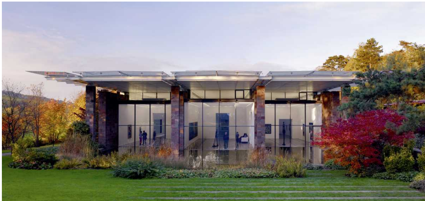
Здание Фонда Бейлера в Базеле

Швейцарский павильон, о кулинарном и дизайнерском проектах которого мы уже писали, не поражает внешним великолепием, но притягивает визитеров возможностью выпить чашечку хорошего кофе в специально «выращенной» к выставке березовой роще. Те же, кто зайдет вовнутрь, может и знаменитое фондю попробовать, и проникнуть в тайны Сан-Готарда.