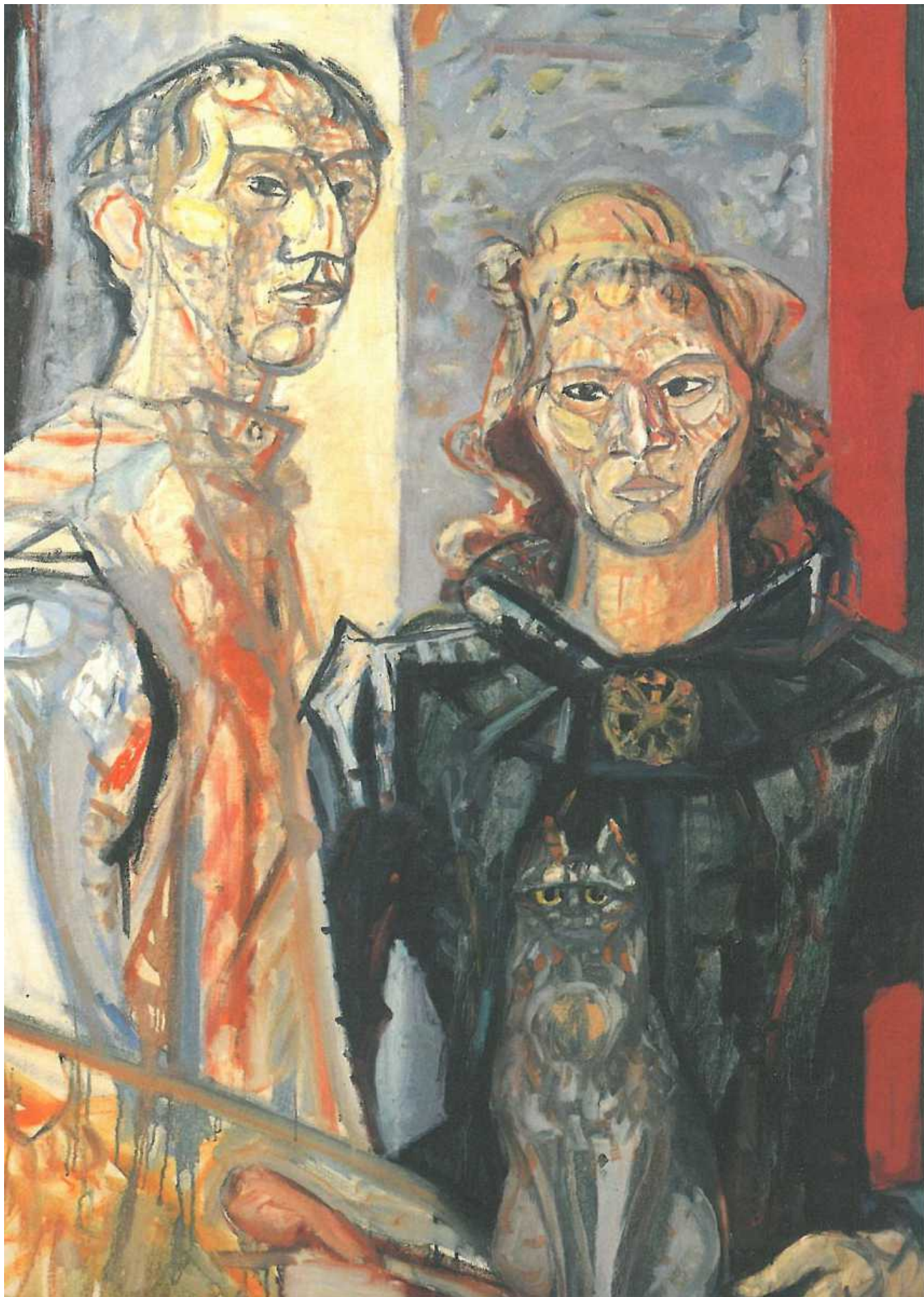
Макс Гублер приобретает такую известность, что в послевоенные годы становится