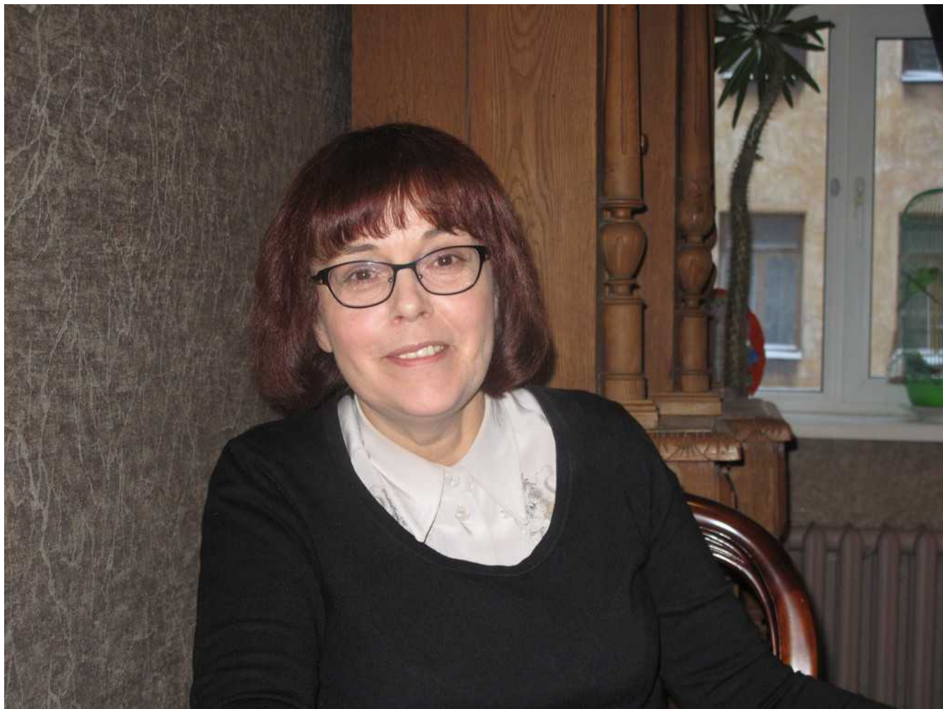
Писатель Елена Чижова