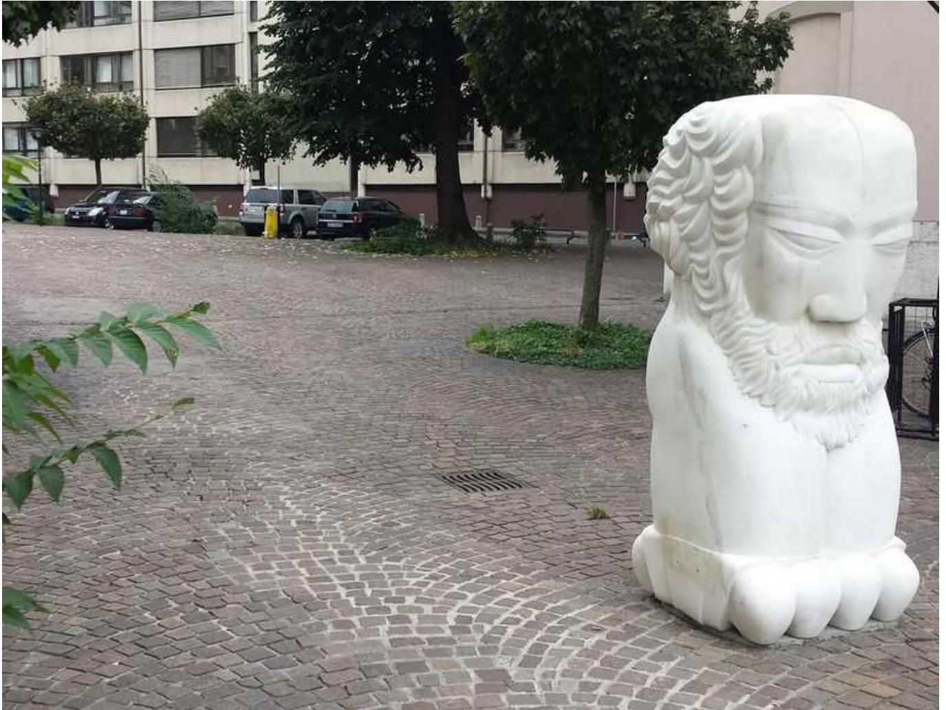
Урсу Дезала

Совсем недавно благодаря интернету у Цереры обнаружился кавалер - на страничке в фейсбуке была размещена вот такая фотография.