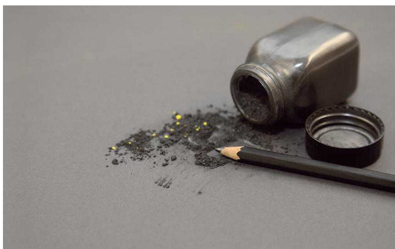
Карандаш 1915 года

В 1929-м компания заявила патент на первый в мире автоматический карандаш Fixpencil (со вставным грифелем).