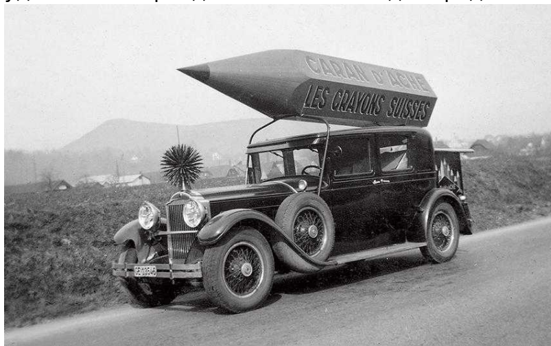
Реклама в 1920-м

Однако «не было бы счастья, да несчастье помогло»: после войны Европа осталась без карандашей из-за многочисленных разрушений, и продукция из Женевы «хлынула» в разные страны. Это способствовало тому, что торговый оборот фирмы удвоился в период с начала 1950-х до середины 1960-х годов.