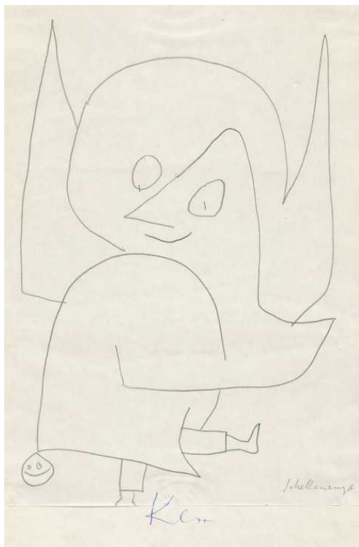
Пауль Клее. Ангел (© Zentrum Paul Klee)

представлены почти 150 произведений живописи и графики выдающегося швейцарского художника, станет последним крупным культурным проектом, организованным в уходящем году в рамках официальных празднований.