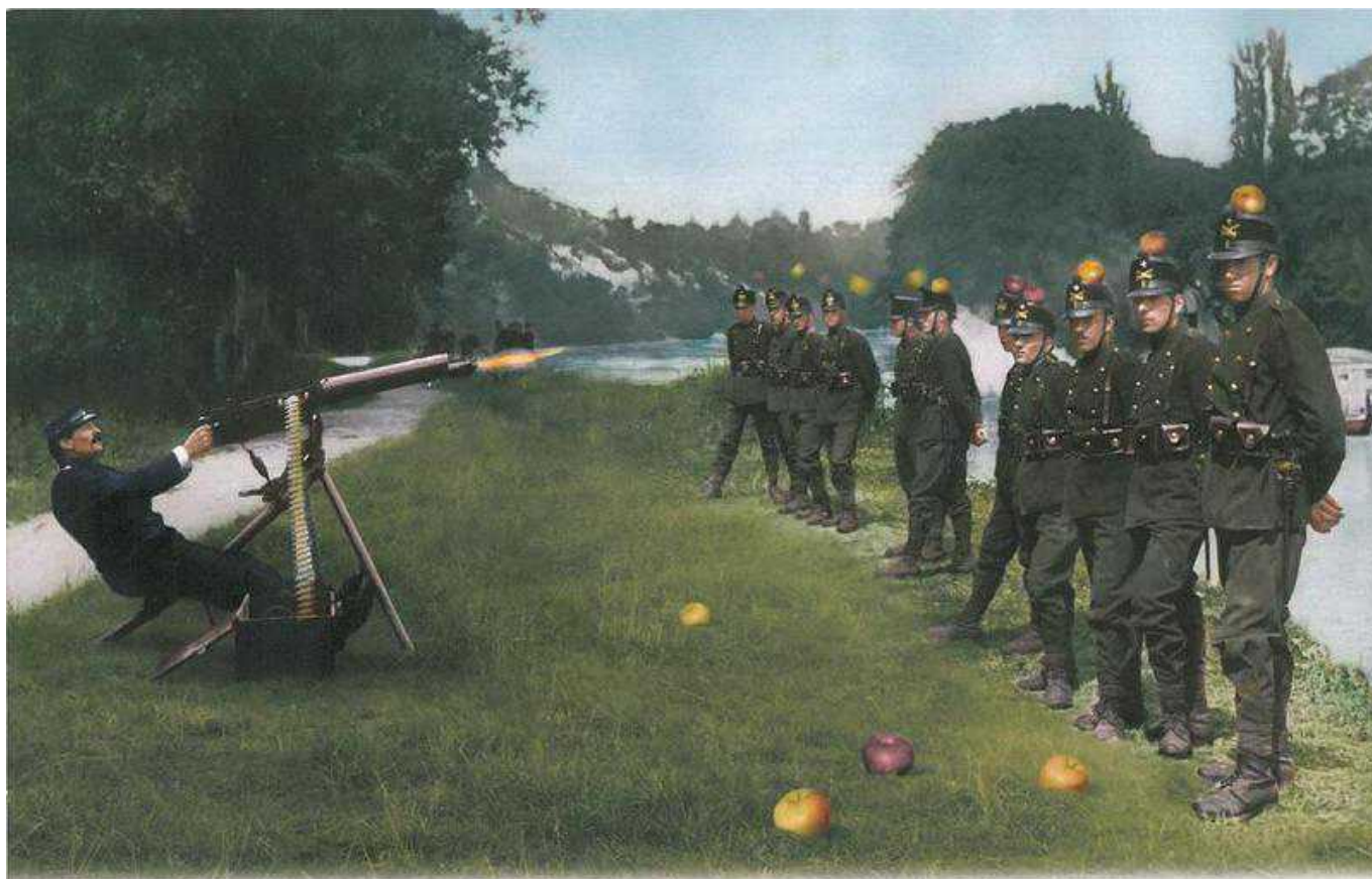
Exercice de tir, mode Guillaume Tell.

Author: Наталья Беглова, референдум 8 марта 2015 , 18.12.2014.