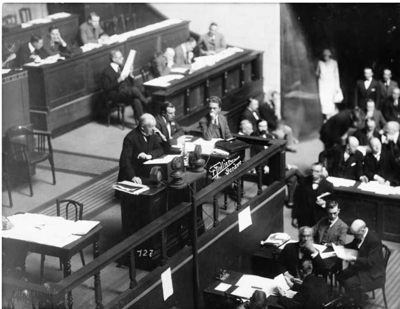
Президент Джузеппе Мотта на трибуне Лиги Наций (UNOG)

Author: Надежда Сикорская, Женева , 18.09.2014.