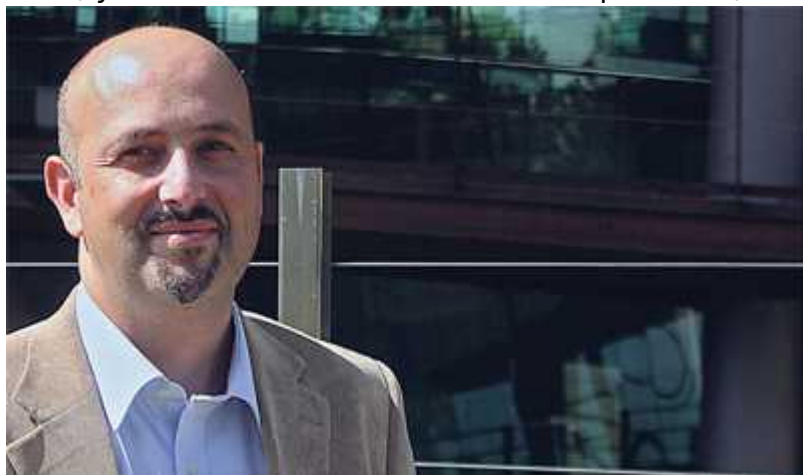
Пальма (Канарский архипелаг).

Имя планете дано по названию американского космического телескопа Кеплер, и это не первая планета, которую выследил зоркий аппарат. Мы же посмотрим, как действовали женевские ученые. При сборе данных они использовали прибор Harps-Nord, установленный на телескопе SuperWASP, который расположен на острове