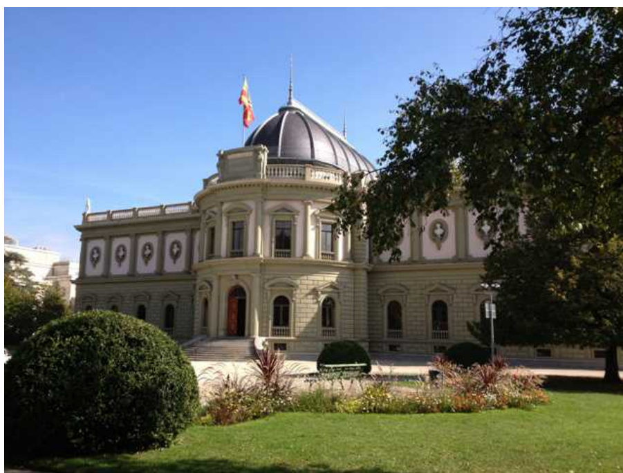
Музей Ариана

узея имеется кафе, из него есть выход на небольшой балкон, откуда открывается вид на Европейское отделение ООН. Осмотрев выставку, я зашла в это кафе и устроилась за столиком на балконе, благо день выдался на удивление теплым. Я уже собралась уходить, когда на балкон ввалилась большая группа русских туристов. Бойкая женщина, очевидно гид, сопровождавший группу, начала рассказывать о музее. Делала она это развязно, снабжала свой рассказ какими-то нелепыми анекдотами, якобы произошедшими с создателем музея. Потом стала комментировать вид, открывающийся с балкона. Бодро поведала про Монблан, не забыв вставить всем приевшуюся шутку о японских туристах, которые принимают за Монблан небольшую гору, очень невысокую, своим силуэтом напоминающую такую дорогую японцам гору Фудзияма. Ее, в отличие от Монблан, почти всегда видно, поскольку она находится гораздо ближе к Женеве, и обманутые недобросовестными гидами японцы с