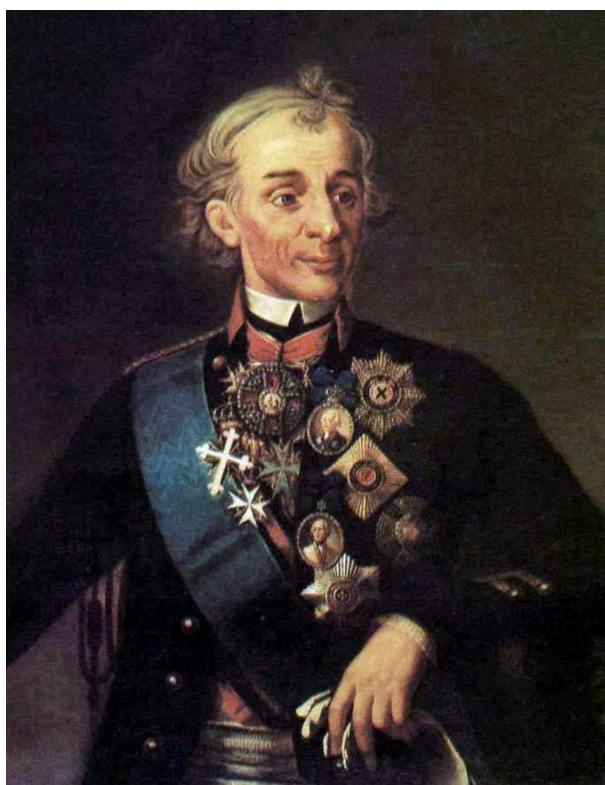
Портрет Суворова кисти Джорджа Доу

Напомним кратко исторический контекст. К концу августа 1799 года в Швейцарии оставался 24-тысячный русский корпус под командованием Александра Римского-Корсакова. Союзные России австрийские войска начали покидать Швейцарию, оставляя 84-тысячной французской армии под командованием Массена возможность без труда справиться с русскими. Поражение отечественной армии означало бы полный торжество французов в Швейцарии, лишая ее надежд на независимость.