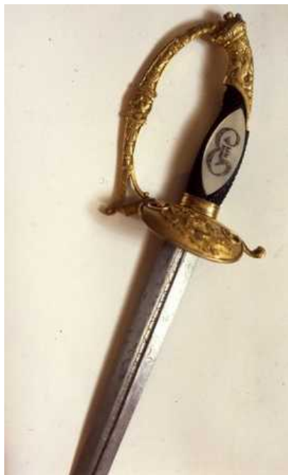
Сабля Суворова

Обращаем ваше внимание на предстоящие празднования в честь очередной годовщины Швейцарского похода Суворова.