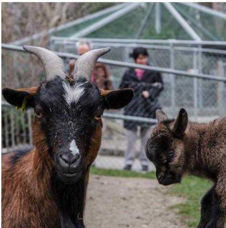
Ревильйо (1817–1890), затем