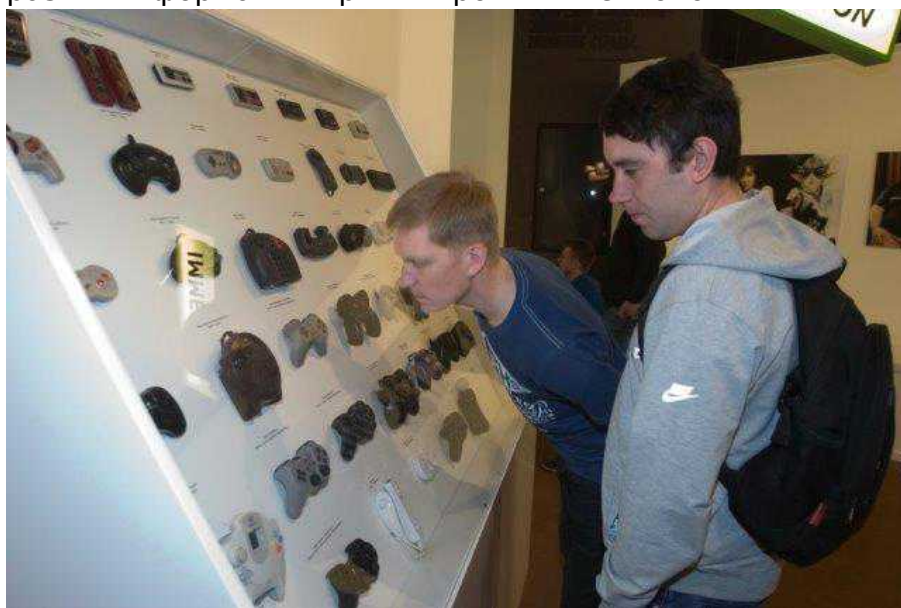
Подростки Красноярска - в мире видеоигр

Это связано с представлением в музеях этих городов придуманной и реализованной нами выставки Playtime – Videogame mythologies. В России это название выглядело так: Playtime – мифология видеоигр. Как несложно догадаться из названия, выставка посвящена культуре видеоигр и взаимоотношениям между игровой деятельностью, разными формами игры и игровыми технологиями.