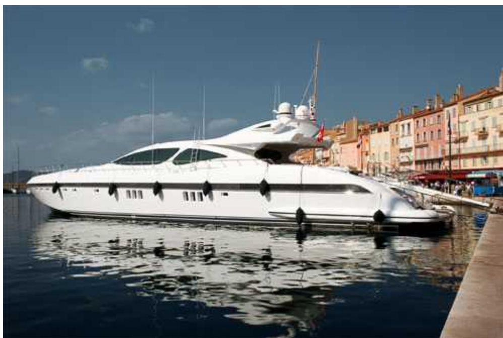
Яхта Mangusta 130

Author: Лариса Ворошилова, Цюрих , 15.08.2013.