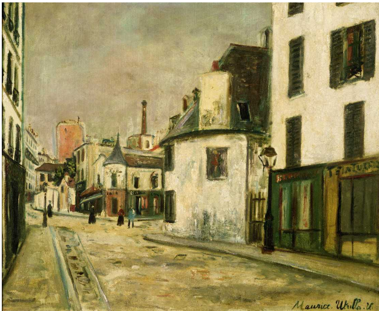
Улица Мон Сен-Сени. Морис Утрилло. 1916 (© Fondation Pierre Gianadda)