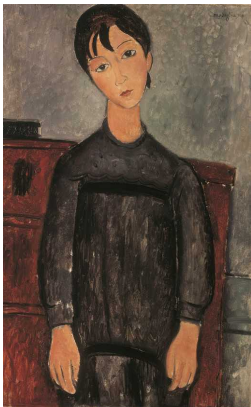
Девушка в фартуке. Амедео Модильяни. 1918 год

При жизни о таком успехе он не мог даже мечтать. Несмотря на выдающийся талант и удивительное, доходящее до иступления стремление достичь наилучшего результата, Моди почти всегда жил в нищете. Периодические всплески интереса к его живописи не приносили стабильного дохода. Единственное, в чем он уступал своему вечному сопернику Пикассо, - отсутствие коммерческой жилки. Отец кубизма умел эпатировать публику, привлекать к себе внимание. Он умел продавать свои картины.