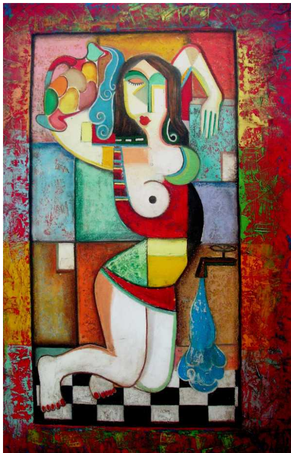
"Утренняя ванна" Давида Мартиашвили

ая палитра, особая техника письма - перешедшая от отца и обогащенная талантом сына. Как говорит сам художник, картины его должны вызывать у человека ощущение праздника, ибо они оптимистичны по духу. А это особенно важно в мире дисгармонии и жестокости.