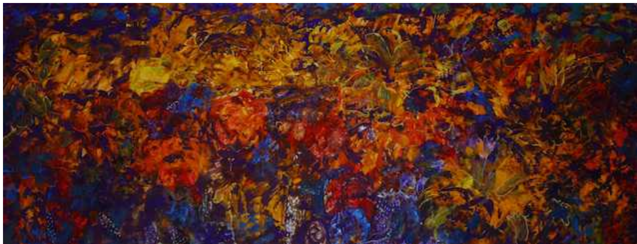
"Ночь Майа" Ильи Ярового отношения США и Швейцарии

Source URL: https://nashgazeta.ch/news/culture/magiya-cveta-iz-gruzii-i-ukrainy