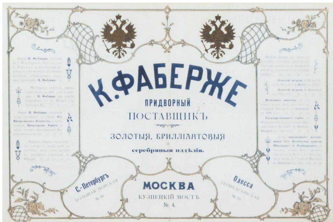
Реклама Фаберже (Igor Carl Fabergé Foundation)

каждый интересующийся наследием Фаберже читатель найдет в ней что-то, о чем и не подозревал.