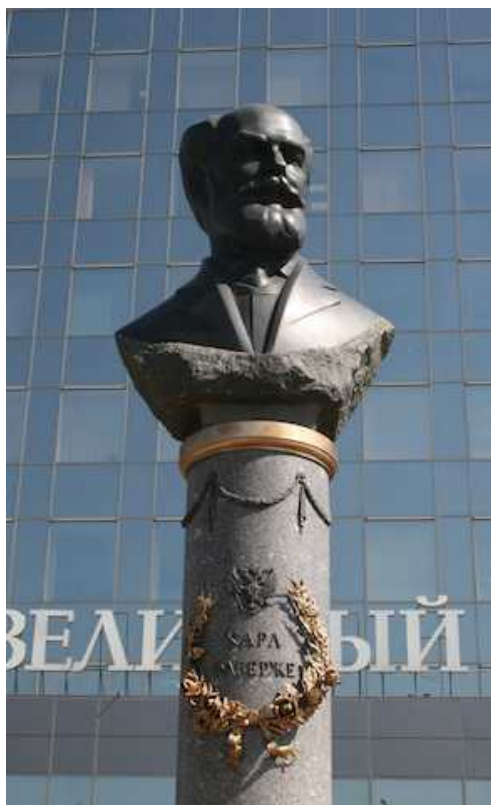
Бюст Карла Фаберже в Санкт-Петербурге