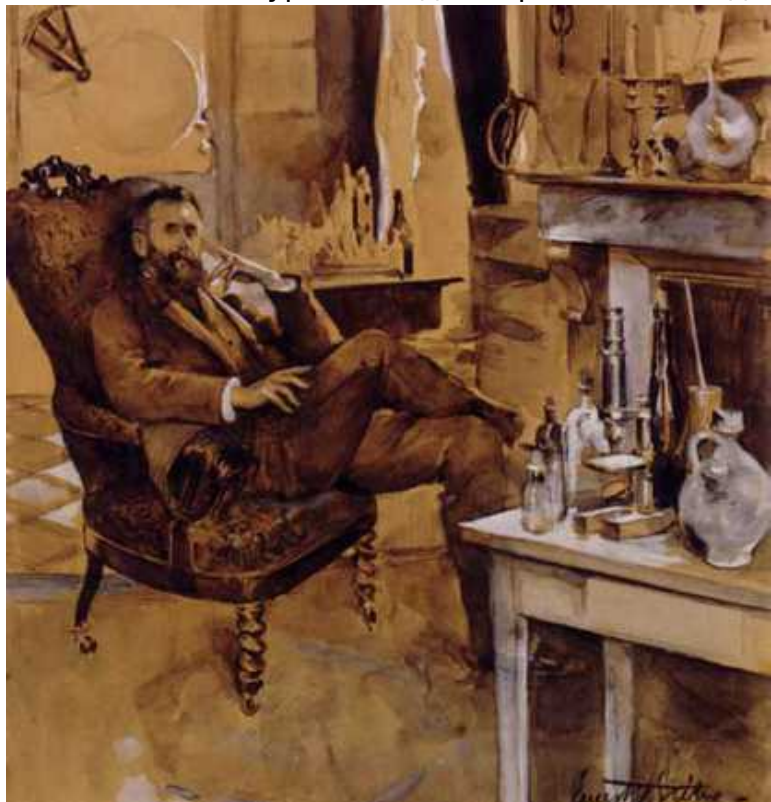
Форелем в 1890 году. Ему удалось

Разгадка крылась в явлении «сейшей» - колебаний уровня воды. Термин был введен