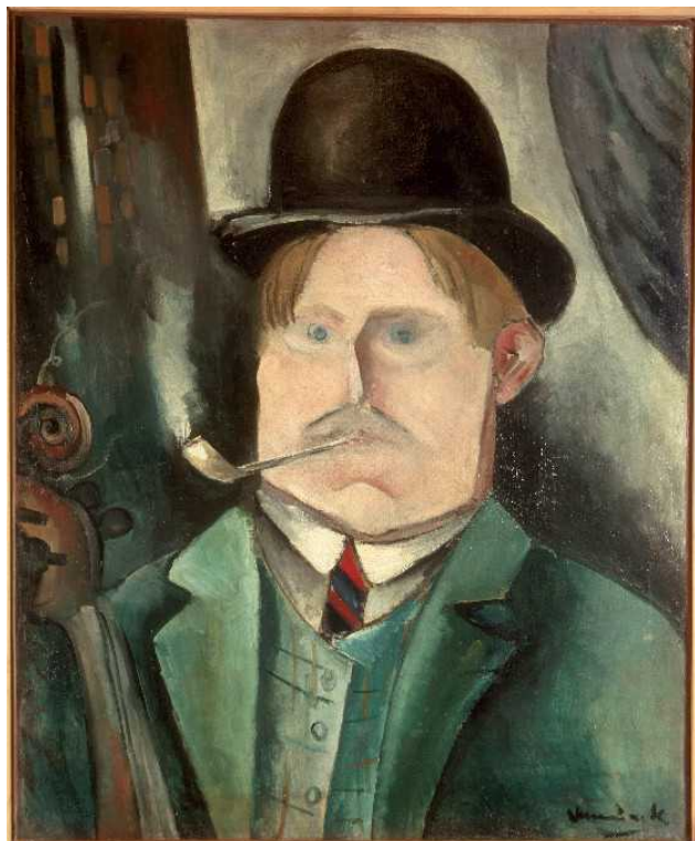
Автопортрет. Морис Вламинк. 1911(© ProLitteris)

Изобразить самого себя, наверное, самая сложная задача для художника. Каким предстать на картине? Как себя понять? Как научиться смотреть на себя со стороны? При этом необходимо удержаться от явного нарциссизма. Автопортрет, своеобразный опыт самопознания, должен соотноситься не только с самоощущением художника, но и выражать его эстетические принципы. Такая двойственность в значительной мере усложняет работу, вынуждая к искусственному разрыву между двумя сторонами цельной личности. Но именно автопортреты раскрывают для нас художника как человека, возможно, даже лучше любых других его картин.