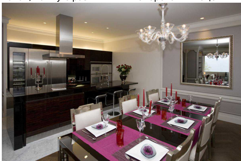
Убранство квартиры-прототипа

Но как же будут выглядеть апартаменты изнутри? Мы смогли получить об этом представление, зайдя в прототипную квартиру, неожиданно оказавшись за дверью самого настоящего барака. Окинув взглядом современную кухню, мебель в серых тонах, ванну с различными наворотами и оце