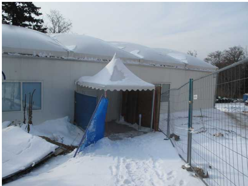
Барак, в котором спрятали квартиру-прототип

Но в чем же изюминка проекта, его, так сказать, прибавочная стоимость? На наш взгляд, в выборе качественных партнеров: архитекторов, дизайнеров, декораторов, ландшафтистов, а также в установлении привилегированных отношений с расположенным по соседству 5-звездочным отелем Le Mirador Kempinski и международной службой консьержей Quintessentially, которые представят будущим обитателям комплекса широкий спектр собственных услуг. Так, владельцы апартаментов обновленного Du Parc смогут пользоваться сигарным салоном Davidoff и великолепным спа Givenchy в Le Mirador, а консьержи международного класса проконсультируют их по любым вопросам: выбор вина, бронирование мест в концерты и на спектакли, предоставление машины с шофером, подбор изысканного подарка, заказ еды на дом... то есть, удовлетворение всех тридцати трех желаний гарантировано!