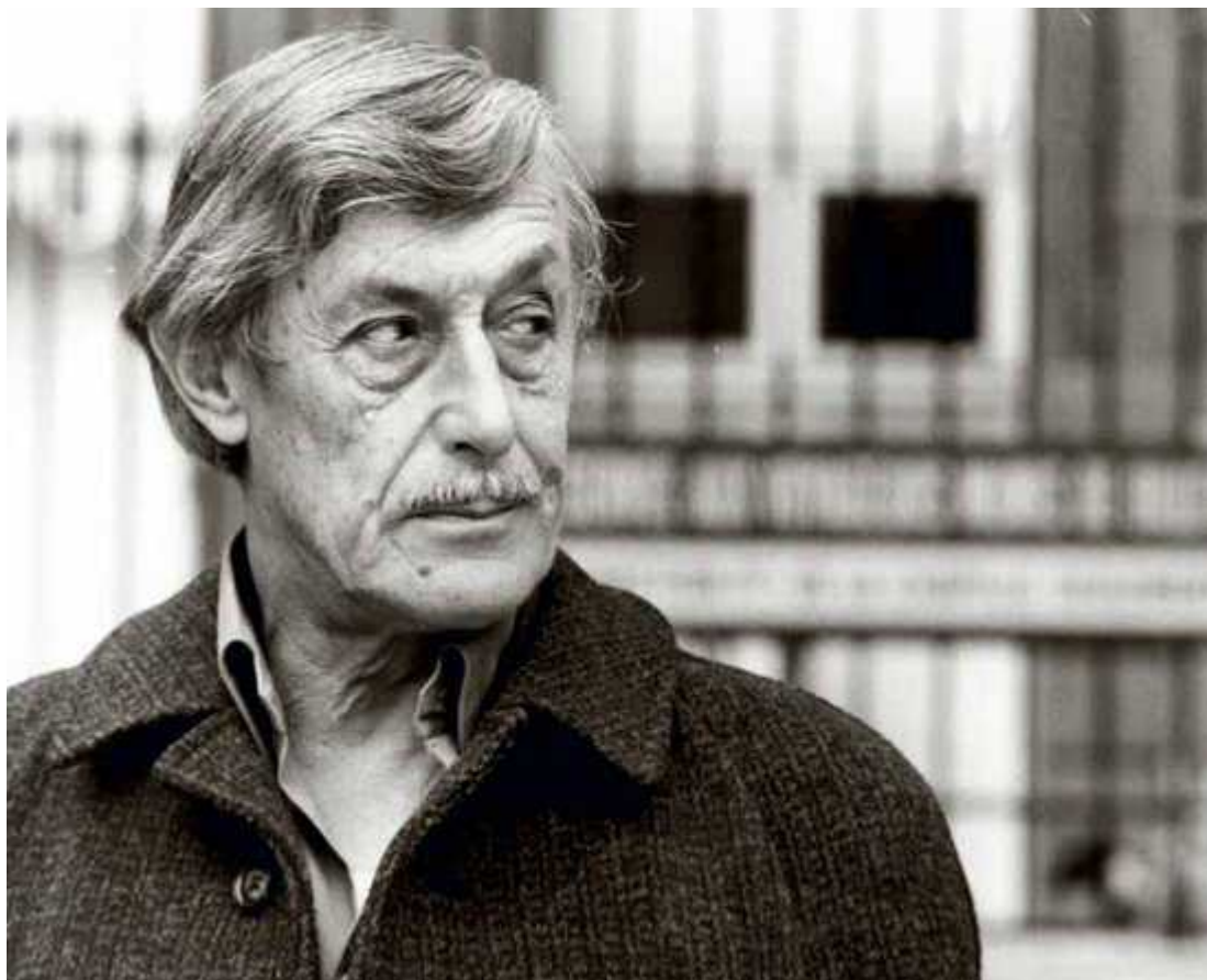
Виктор Платонович Некрасов (1911-1987)

Накануне вечера , который Русский кружок при Женевском университете посвящает 100-летию со дня рождения известного российского писателя, предлагаем вашему вниманию письмо, написанное его коллегой и другом, выдающимся французским славистом Жоржем Нива 25 лет назад – к 75-летию Виктора Некрасова.