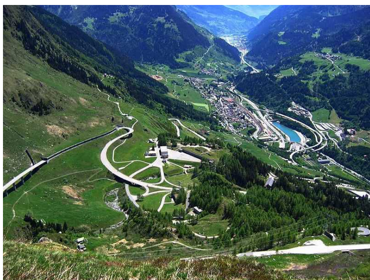
Панорама города Эроло сегодня

Кантон Тичино – самый теплый и благодатный в Швейцарии. Обласканный солнцем, изобилующий тропическими фруктовыми садами, насыщенный культурной жизнью: на его территории проходит кинофестиваль в Локарно, джазовый фестиваль в Лугано и недели классической музыки в Асконе. Тичино – ворота из Швейцарии в Италию. Кантон стал частью Конфедерации всего лишь в 1803 году. Тесные связи с Италией сохранились до наших дней. Это единственный полностью италоязычный швейцарский кантон (в соседнем Граубюндене говорят на трех языках – итальянском, немецком и рето-романском). Топоним «Тичино» происходит, вероятно, от кельтского названия одноименного притока реки По, по-латыни «Ticinus», по-французски «Tessin». Что оно означало, этимологи разгадать до сих пор не могут. А вот разобраться в особенностях психологии тичинских крестьян нам поможет очередная легенда из цикла мифов и преданий славной Гельвеции.