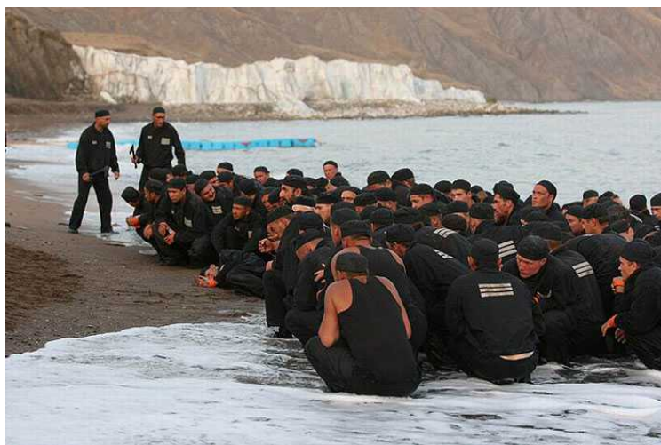
"Новая земля"