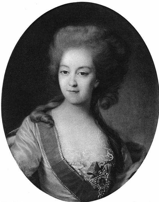
Портрет княгини Екатерины Николаевны Орловой. 1738-1781 | La Princesse Catherine Nikolaeowna Orloff. 1738-1781

В Благовещенской церкви Александро-Невской лавры в Санкт-Петербурге, среди прочих могил знаменитых и безвестных людей, значится и могила княгини Екатерины Николаевны Орловой, урожденной Зиновьевой. Все путеводители, справочники, энциклопедии утверждают, что тело двадцатидвухлетней, скончавшейся в расцвете молодости в Лозанне княгини было вскоре после кончины торжественно перезахоронено в Петербурге. Казалось бы, все логично. Юная, безвременно ушедшая и горячо оплакивавшаяся супруга знаменитого князя Григория Григорьевича Орлова, бывшего фаворита Екатерины II, обрела место своего последнего упокоения на родине...