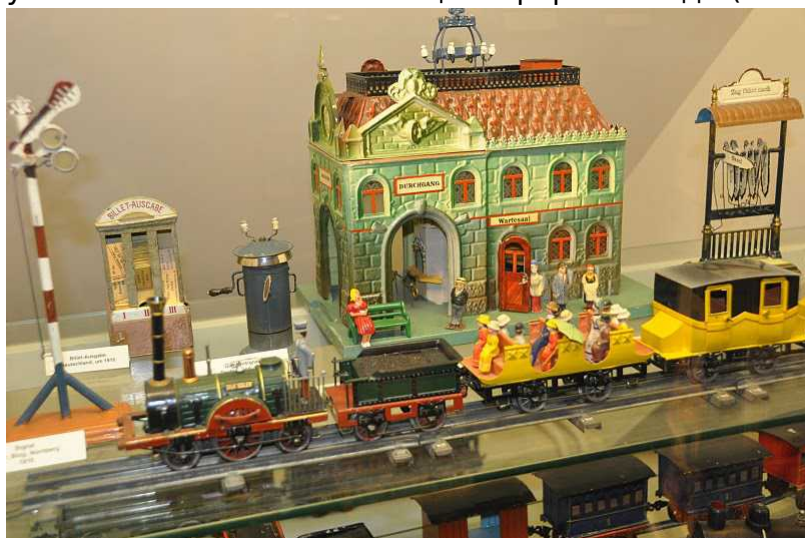
Музей игрушек семьи Вебер

Преодолевая желание последовать примеру этого служителя, я продолжала путь, ведь планов было громадье: открытие экспозиций священного искусства Гималаев и королевства Бутан с их шелковыми картинами и рисунками из цветного песка и таинственный древний Египет с его культом животных – кошек, ястребов и крокодилов, которые замечательно расположились в музее Ритберг; занявшая четыре этажа выставка «Ganz konkret» в Хаус Конструктив - триумф строгих форм от Гюнтера Фрутрунка (ставшего в 1970 году автором знаменитого дизайна упаковочного пакета немецкой фирмы Альди (ALDI), с которым до сих пор ходит