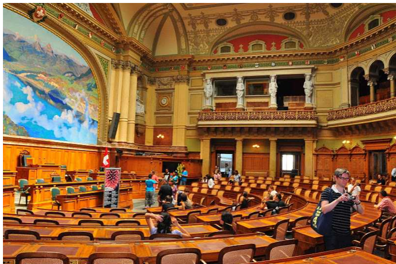
Зал заседаний Национального совета

Но когда Альбрехт, австрийский герцог, стал немецким кайзером, с миром в трех странах было покончено. Прежние немецкие властители оставляли горный народ в покое и довольствовались регулярным сбором налогов. Горцам это не мешало, они были свободны и уважали Кайзера. Однако Альбрехт задумал навсегда поработить прекрасную горную страну и подчинить себе пастуший народ. Вскоре в трех странах появились жестокие представители Альбрехта, ландфогты, которые взяли правление в свои руки и сделали все, чтоб унижить и подчинить австрийской короне гордецов.