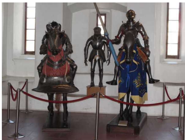
Рыцари Грансона

Однако на Грансон, как и на другие земли, некогда принадлежавшие Савойскому графству, претендовал серьезный соперник – молодая Швейцарская Конфедерация, к тому времени прославившаяся своими воинскими доблестями и, к тому же, успевшая заручиться поддержкой французского короля Людовика XI и императора Фридриха III, недовольных завоевательной политикой Бургундии и Савойи в Европе. В 1475 году войска Берна завладели Грансоном, но уже через год Карл Смелый, бургундский герцог, мечтавший завоевать пол-Европы, решил вернуть принадлежавший ему город. Перед его артиллерией швейцарский гарнизон не устоял и добровольно сдался. Но разгневанный герцог решил наказать посягнувших на его владения швейцарцев и казнил 412 солдат гарнизона. Такая жестокость возмутила Берн и его союзников.