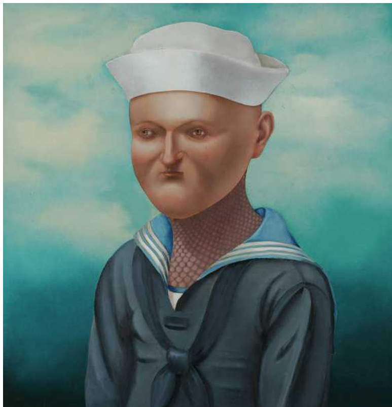
Ритумс Иванов (Латвия), Размышление, 2008

Галерея из Санкт-Петербурга G-77, созданная в 2003 году, позиционирует себя как