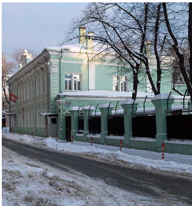
Здание Посольства Швейцарии

В прошлом году правительство Швейцарии обратилось к Парламенту с просьбой выделить кредит в 39,5 миллионов франков на реставрационные работы и увеличение площади главного здания Посольства – с целью снова собрать под одной крышей все отделы и службы. Но Национальный Совет – нижняя палата Парламента – отклонил выдачу кредита: предлогом стала необходимость пересчитать сумму на ремонтные работы. Дело в том, что предварительная сумма была рассчитана на базе примерной цены подобного проекта в Швейцарии, так как в Москве проект находился в стадии разработки, и это затрудняло определение его стоимости. В результате, сумму пересчитали на месте, что позволило «сэкономить» 200 000 франков.