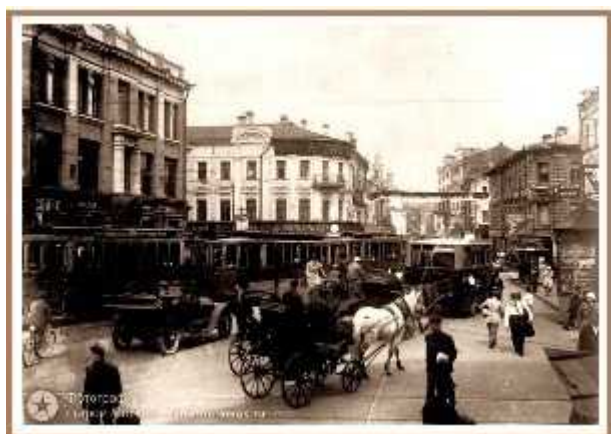
Старая Мясницкая

Главное здание Посольства Швейцарии в Москве находится в веренице тихих улочек старинного центра, в одном из особнячков, стены которых дышат историей и уютом. Название переулочка, где оно располагается, хранит память об обширных огородах, раскинувшихся с 17-го века на плодородных землях за Поганым прудом. Огороды были непростые: выращенные здесь овощи отправлялись на царский и патриарший столы. Уже тогда переулок, проходивший по центру Огородной Слободы, носил ее название. В начале XVIII века Поганый пруд – сюда сбрасывались отходы с боен и мясных лавок, о нахождении которых неподалеку свидетельствует улица Мясницкая, - вошел в состав московского имения князя Александра Даниловича Меншикова и превратился в «Чистый».