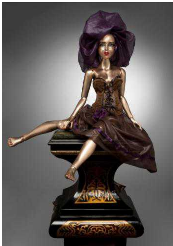
Елена М. Рита, 2009

Внимание женевской публики привлекла организованная галереей в прошлом году выставка работ ярчайших