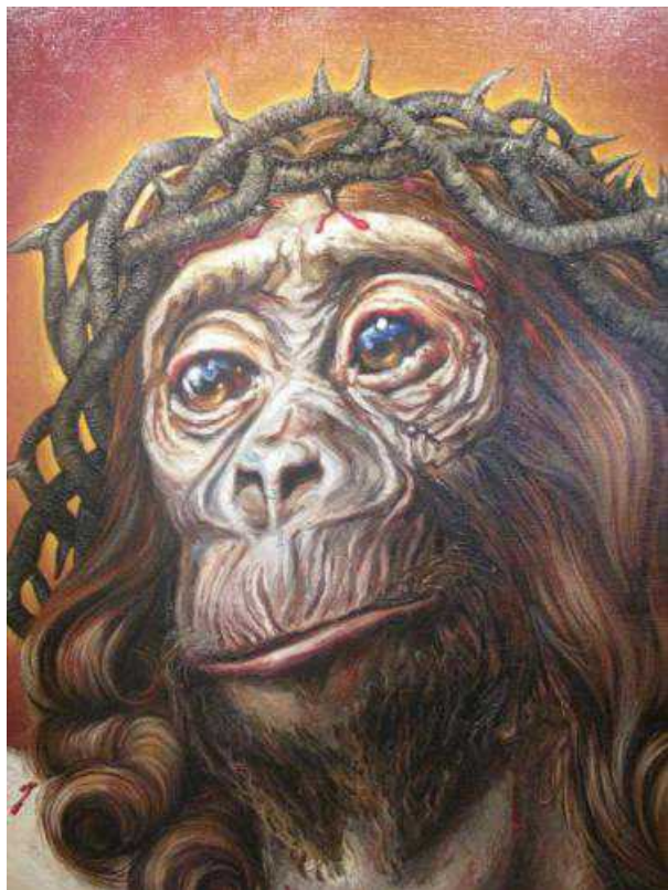
Илья Шишкан, "Пасха", 2010 ©NG

Стили и сюжеты, представленные на этом стенде, самые разные, что называется, на любой вкус.