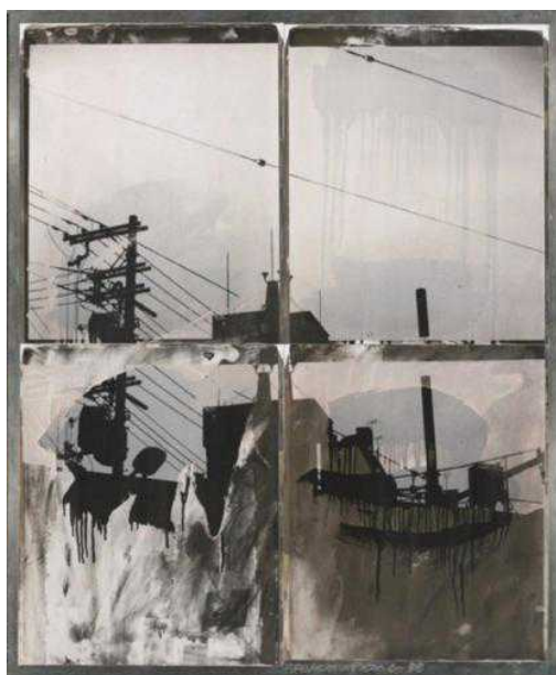
Роберт Раушенберг "Японские небеса"

После того, как его вынудили подать в отставку, Лэнд не захотел простить обидчиков... Он продал свои акции компании и даже не присутствовал на праздновании 50-летнего юбилея Polaroid в 1981 году. Фирма достигла звездного часа в 1994 году, продав товаров на 2,3 миллиарда долларов. Но не успела вскочить в поезд технического совершенства, промедлив с запуском в производство цифровых фотокамер, что и стало для нее роковой ошибкой. С началом цифровой эры в фотографии Polaroid проиграла гонку и в 2001 году обанкротилась.