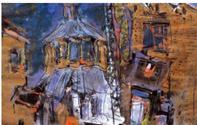
Жак Янкель (Яков Кокоин), "Улей", 1950

Автор: Надежда Сикорская, Эвиан , 26.02.2009.