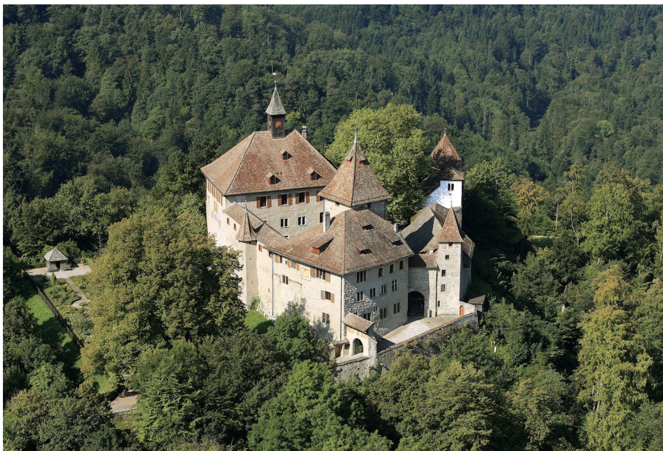
Замок Кибург.