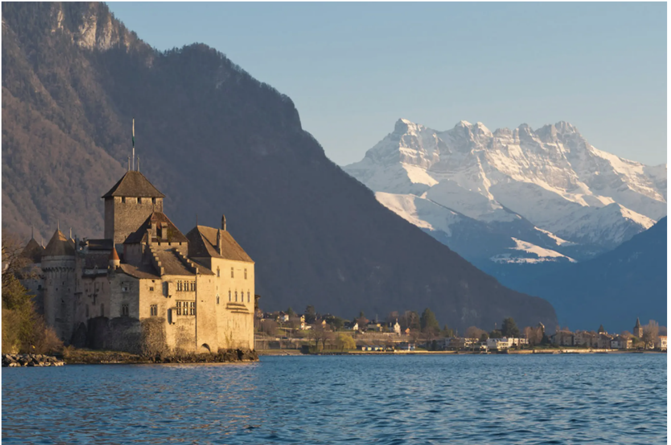
Шильонский замок.

Что касается Романдии, то один из самых известных ее замков – Шильонский – подготовился самым серьезным образом. Вы сможете попробовать свои силы в качестве суконщика и открыть для себя этапы производства тканей, включая прядение, окрашивание, ткачество. Кроме того, будут открыты двери «скриптория», где можно будет взять в руки перо и приступить к изготовлению рукописи. Многих наверняка заинтересуют ателье геральдики и возможность создать собственный герб, самостоятельно выбрав для него цвета, каждый из которых имеет определенное значение.