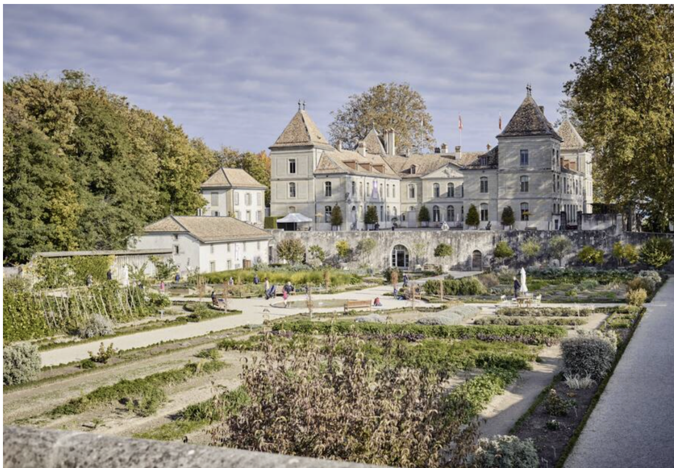
Замок Пранжен.

Наконец, в италиязычном Тичино, в замке Монтебелло, будет организовано целое средневековое представление – с боями, историческими играми, ремесленными лавками и возможностью попробовать традиционные блюда. Если вас всегда увлекала историческая реконструкция, то смело отправляйтесь в это воскресенье в Беллинцону .