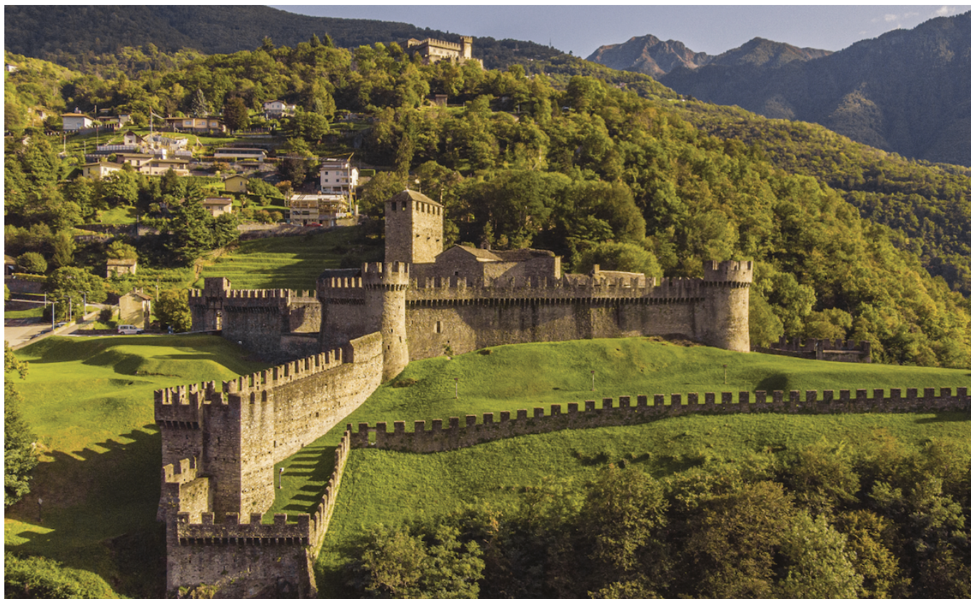
Замок Монтебелло. Фото: fortezzabellinzona.ch

Автор: Заррина Салимова, Берн , 03.10.2025.