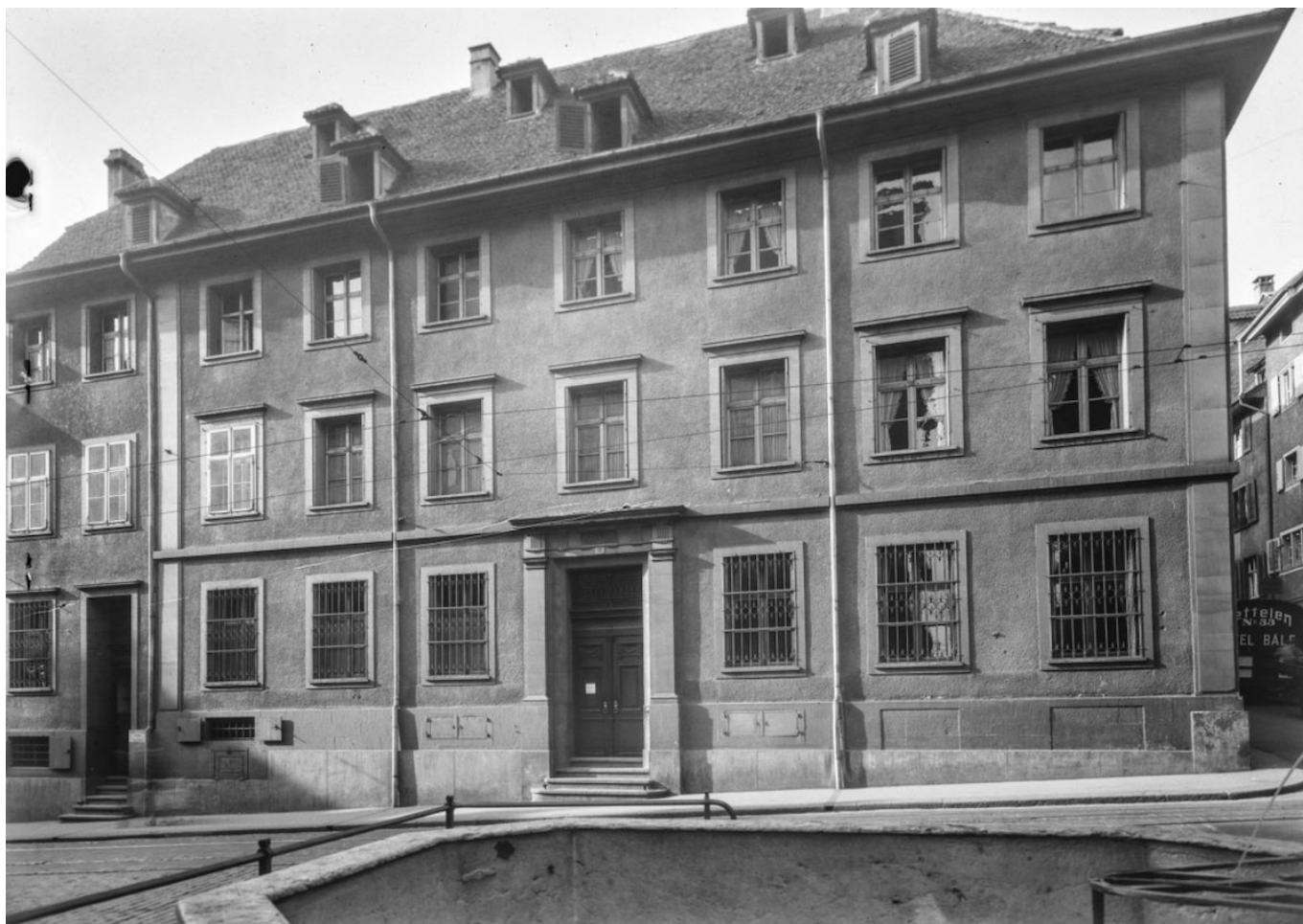
Так выглядел Сегерхоф