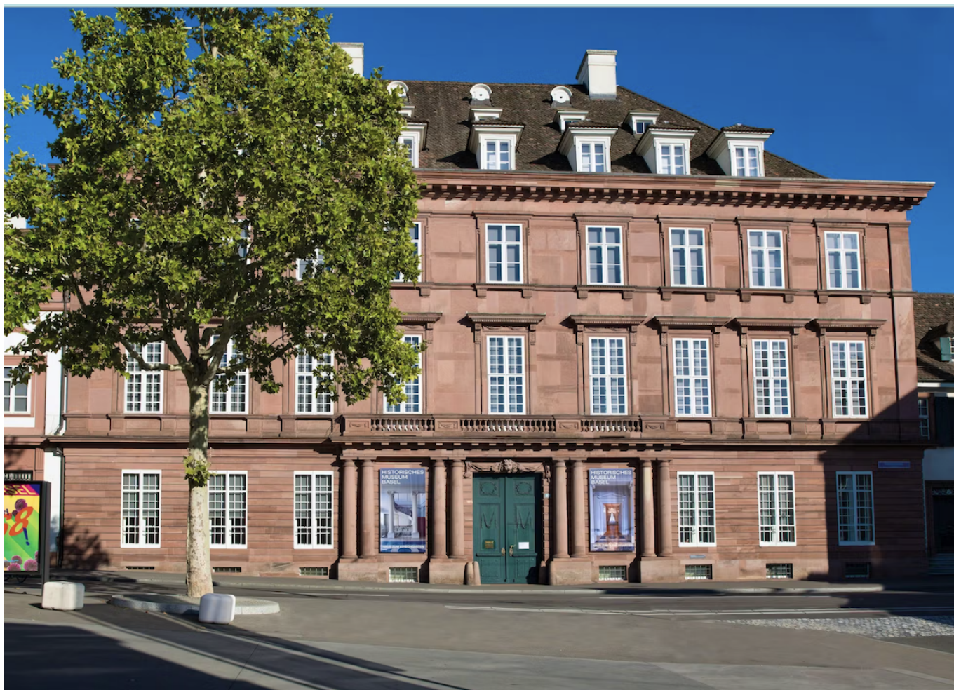
Музей «Haus zum Kirschgarten».

немецкого как «Дом у вишневого сада»), одном из трех филиалов Базельского исторического музея. Оно таинственным образом исчезло из витрины, оборудованной системой сигнализации. Судя по всему, преступление было замечено не сразу: музей обнаружил пропажу в конце мая и сообщил об этом в полицию. Расследование до сих пор не увенчалось успехом. Стремясь увеличить вероятность того, что кольцо будет найдено, музей предал дело огласке.