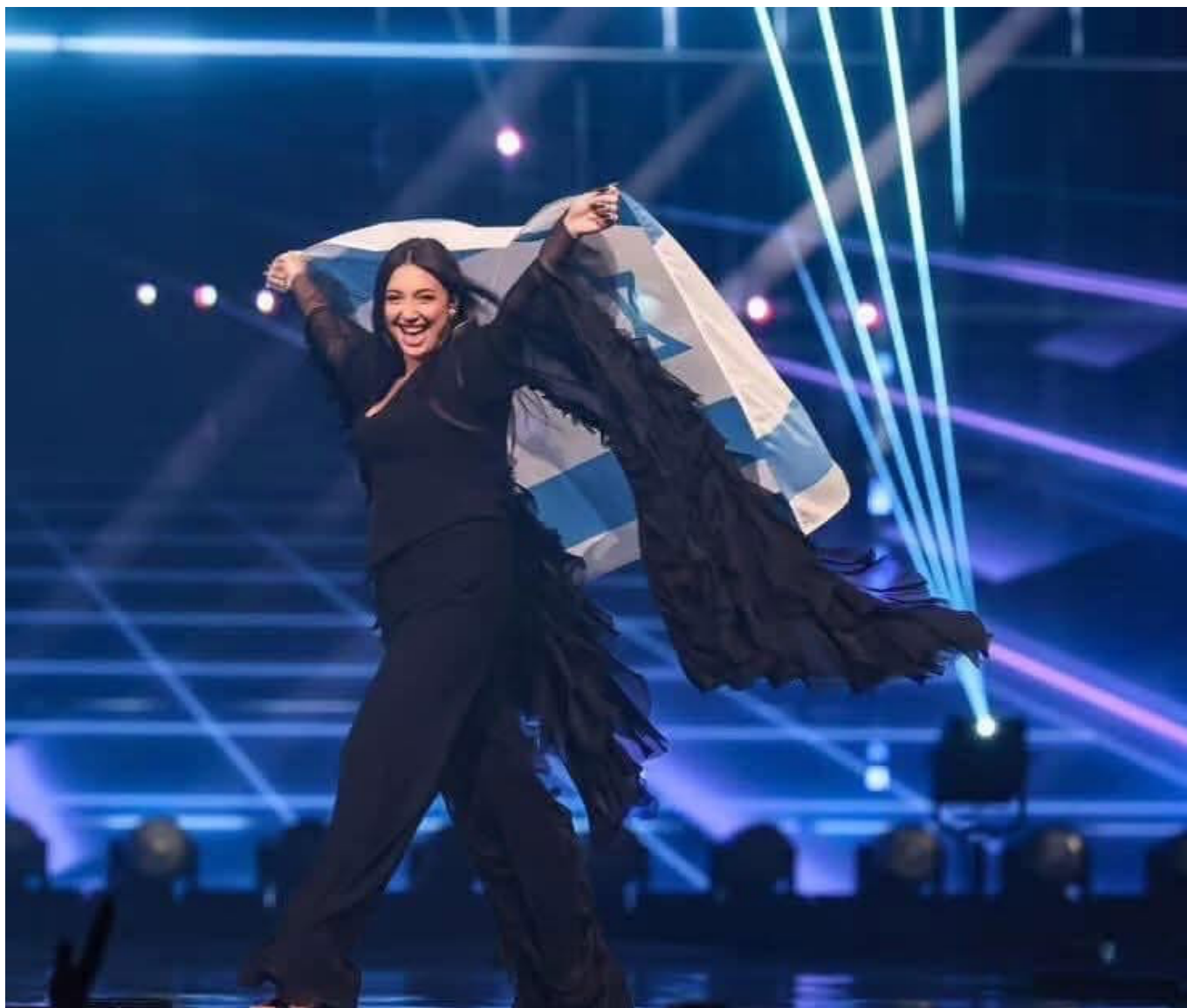
Юваль Рафаэль - второе место

Поведение «отдельных групп», всегда анонимных и чаще всего с закрытыми лицами, уже мало кого удивляет. Удивило публичное заявление Немо. Победитель конкурса 2024 года, в последнее время живущий в Лондоне, привлек к себе внимание, заявив в интервью британскому СМИ HuffPost, что участие Израиля «не имеет смысла». Позже артист также направил СМИ письменное заявление, в котором выразил свою поддержку «призыву к исключению Израиля из конкурса Евровидение». При этом в пятничном выпуске программы La Matinale на RTS он объяснил: «Я хотел сказать, что участие Израиля не соответствует ценностям Евровидения, которое отстаивает мир, единство и права человека. По этой причине я решил ответить на вопрос, который мне задала газета». Немо уверяет, что это не было «призывом» с его стороны, а он «просто ответил» на вопрос о своем мнении по поводу «призыва к бойкоту, который уже существовал». Короче, начал юлить, но все и так понятно, а комментарии излишни.