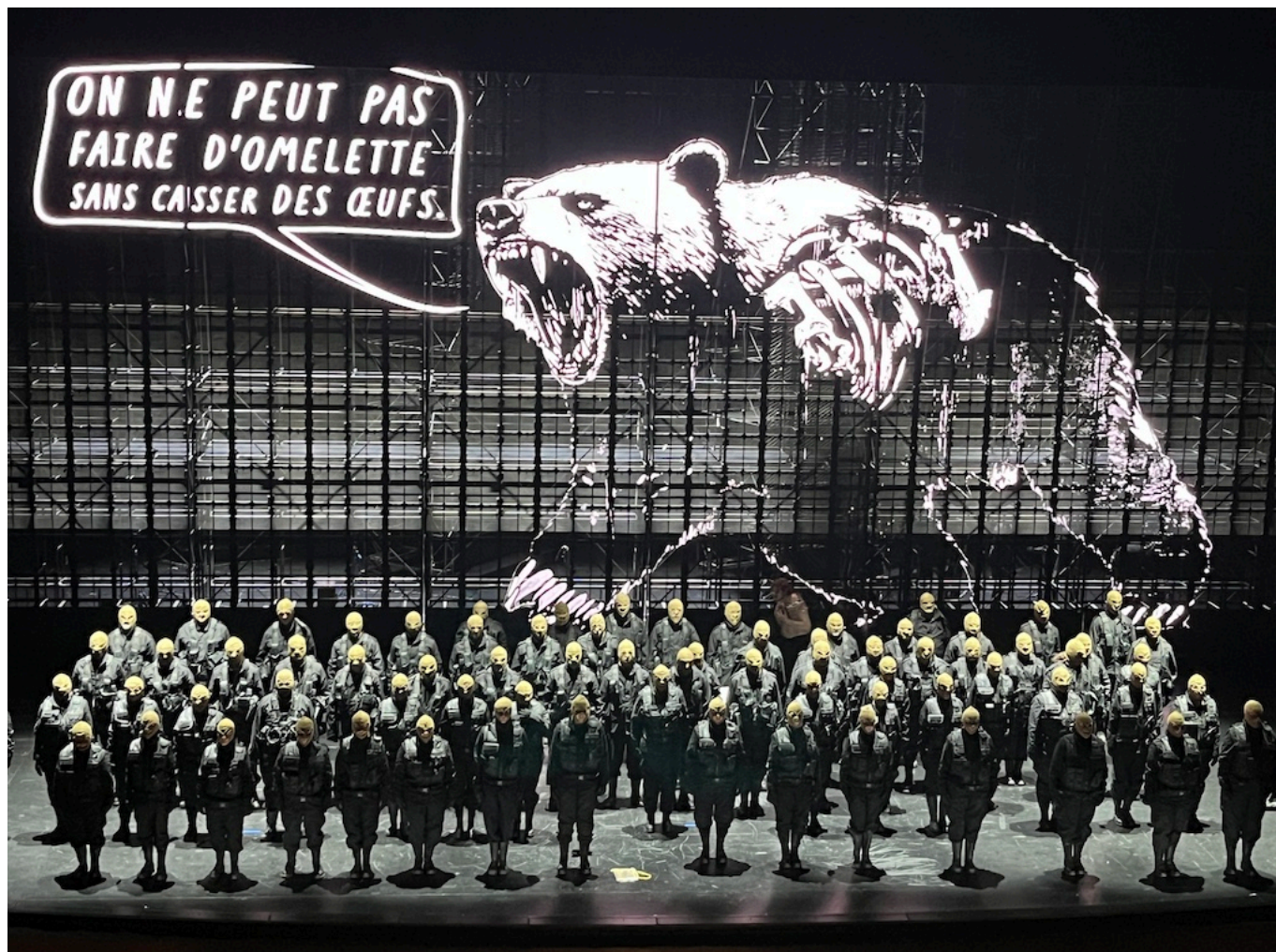
Сцена из спектакля "Хованщина"

Конечно, мы не ожидали увидеть на сцене женевского театра воссоздание постановки Большого театра 1950 года, в течение десятилетий заслуженно считавшейся эталонной. Но не были готовы и к появлению, вместо эпиграфа, «Смерть решает все проблемы. Нет человека - нет проблемы», после чего, на фоне знаменитой прекрасной увертюры «Рассвет на Москве-реке», регулярно исполняемой в концертах как самостоятельное симфоническое произведение, сначала массовки с чемоданами, а потом гроба Сталина - прямоком из фильма «Смерть Сталина» , но еще и в окружении танцующих на заднике сцены лебедей. Намек поняли: смерть, «Лебединое озеро», а Петр Ильич уже далече и не возмутится тем, что «его» лебеди танцуют под чужую музыку. (Лебедей далее сменяют сначала коды российских хакеров, затем фреска в стиле соцреализма и порядком поднадоевший уже «русский медведь».) Интересно, что есть один исторический факт, о котором Каликсто Биейто вряд ли знает, но который мог бы в какой-то степени оправдать такое начало спектакля. Дело в том, что именно «Хованщина» шла на сцене Большого театра на следующий после похорон Сталина день, после трехдневного траура. Народная артистка СССР Вера Давыдова, пользовавшаяся особым расположением «отца народов», была великолепна в роли Марфы, за исполнение которой она получила в 1951 году свою третью Сталинскую премию первой степени. И можно только догадываться, о чем певица думала в тот вечер, призывая на помощь «силы потайные, силы великие, души, отбывшие в ми-и-р неведомый»?