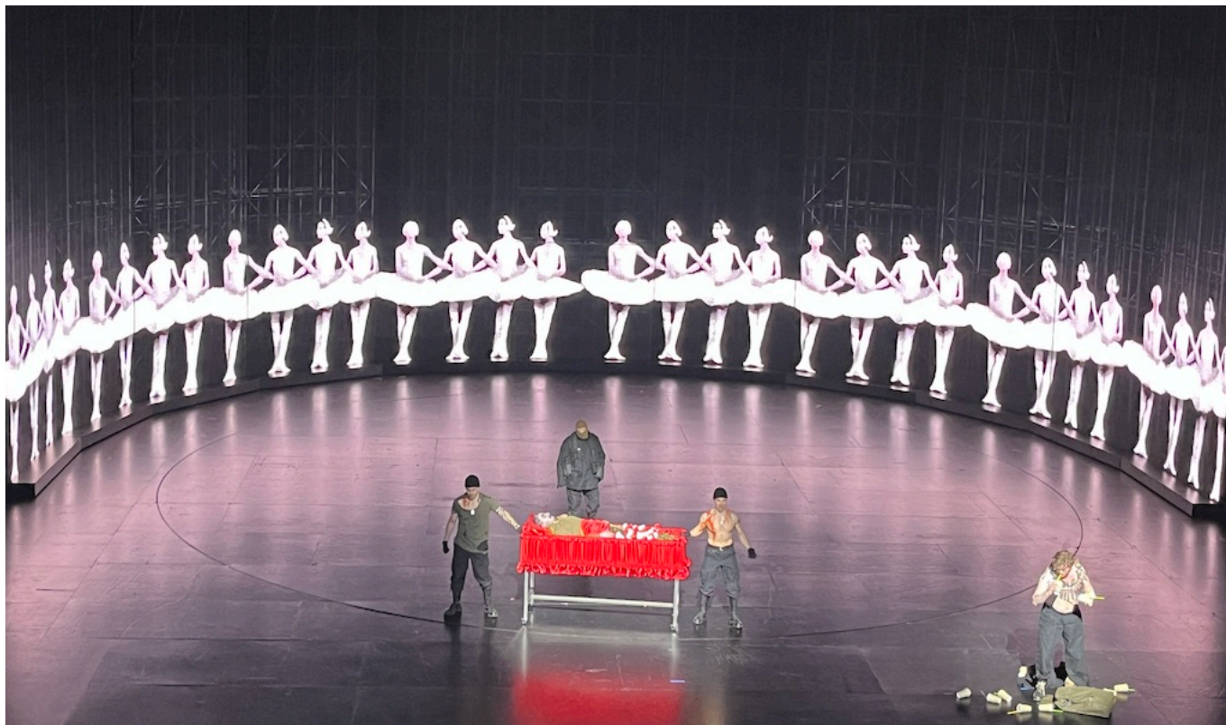
Начало оперы "Хованщина".