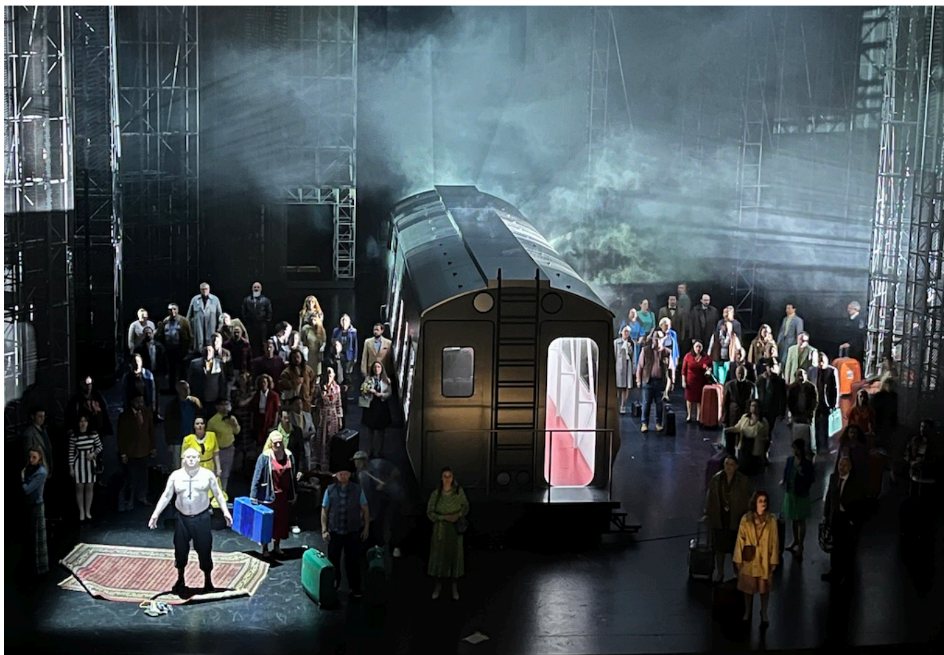
Финал оперы "Хованщина".

Не думаем, что эта постановка войдет в число «нетленок». А вот сама опера вовсе не утратила актуальности. Очень жаль, что авторы спектакля не уделили большего внимания работе солистов и артистов хора с текстом, имеющим огромное значение. Но русскоязычный зритель наверняка разберет обращенные к толпе слова Хованского «Дети, дети мои! Москва и Русь (спаси Бог!) в погроме великом...», и «считает» упрек Голицына Хованскому «Мы теперь местов лишились, Ты же сам нас уладил, князь, с холопьем поровнял», и стенания Шакловитого, оплакивающего участь Руси («Спит стрелецкое гнездо, спи, русский люд, враг не дремлет»), и предупреждение «Литва проснулась!», и констатацию Иваном Хованским «и так уж на Руси великой не весело, не радостно живётся», и растерянность «пришлого люда», наблюдающего в финале за тем, как горят основные персонажи «Ох ты, родная матушка Русь... Кто же теперь тебя, родимую утешит, успокоит?..» Этот последний вопрос остается открытым. И нужно ли что-то добавлять к контексту?