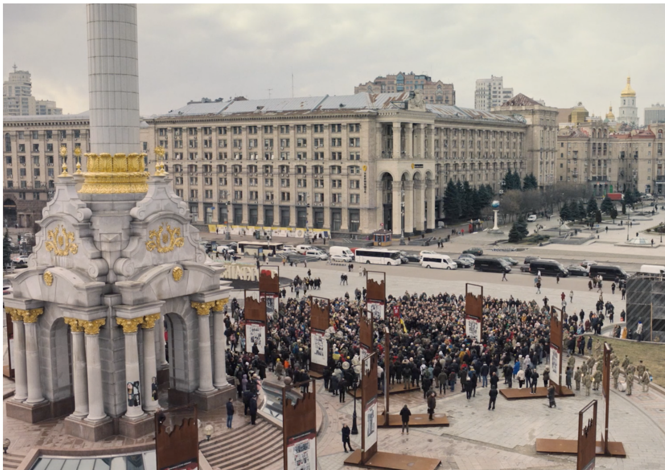
Кадр из фильма «Вторжение»

Скандал с фильмом Анастасии Трофимовой заполнил все медийное пространство и отвлек внимание от других лент фестиваля, а ведь в программе немало по-настоящему достойных картин! Так, в секции «Border Lines», куда включены фильмы, посвященные актуальным вопросам мировой политики, правам человека, социальной напряженности, конфликтам между личностью и государством, представлена новая работа хорошо знакомого нашим читателям украинского режиссера Сергея Лозницы . Его фильм «Вторжение» критики называют документальным эпосом. Режиссер в течение двух лет снимал повседневную жизнь украинцев во время войны, отдав дань уважения их стойкости и создав монументальную картину о нации, борющейся за свою свободу. Картина будет демонстрироваться 4, 9 и 12 октября.