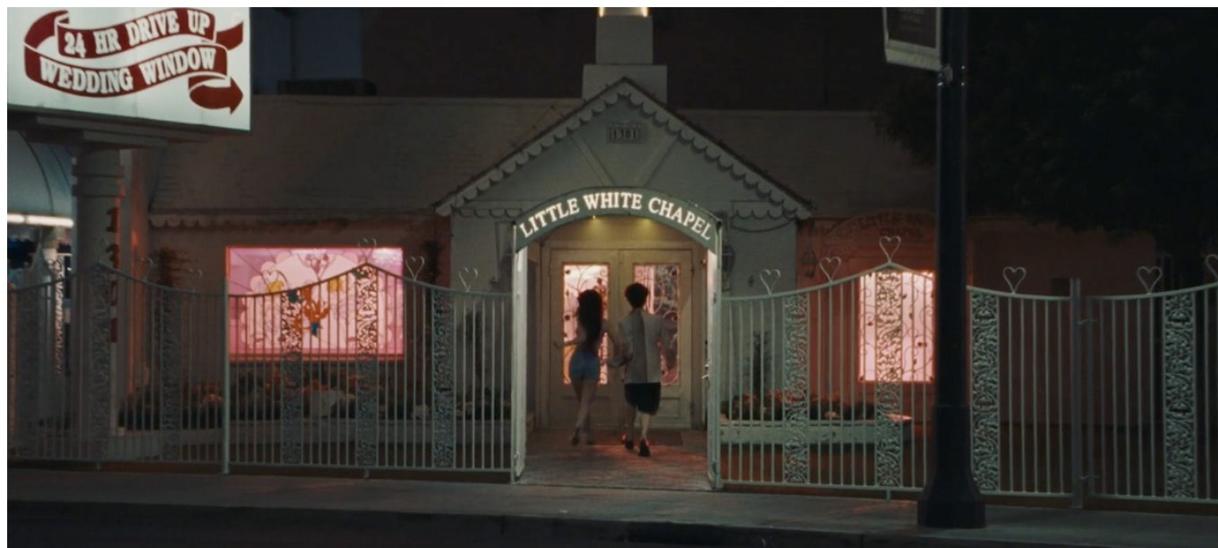
Кадр из фильма «Анора»

которой через рассказ о влюбившейся в таксиста 70-летней вдове говорится о репрессиях в отношении женщин в стране. Не пропустите румынскую картину «Новый год, который так и не наступил» о жизни жителей страны накануне революции и том, как мало нужно было сделать в то время, чтобы свергнуть режим Чаушеску. Кроме того, в Цюрихе покажут американскую сатирическую комедию «Анора»: история любви 25-летней стриптизерши узбекского происхождения и 21-летнего сына русского олигарха, живущих в Нью-Йорке и решивших спешно пожениться в Лас-Вегасе, не оставила равнодушными членов жюри Каннского фестиваля, присудивших картине «Золотую пальмовую ветвь».